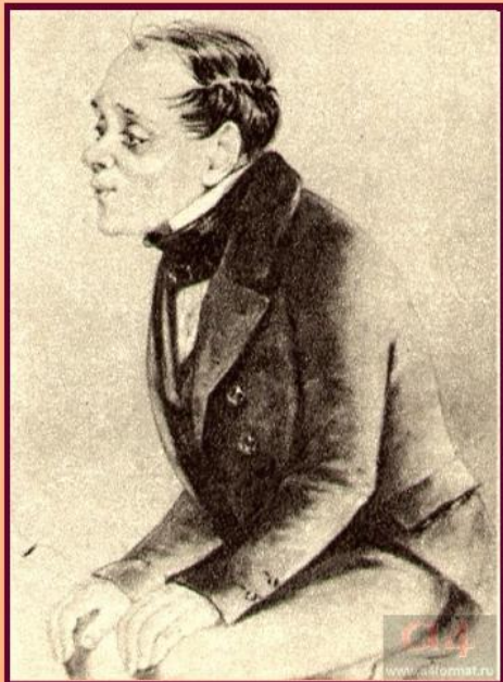
Художник П. Боклевский

Макар Девушкин был первым откровением "великой идеи" Достоевского — идеи "восстановления человека", духовного воскрешения забитых и бедных людей, униженных и оскорбленных.