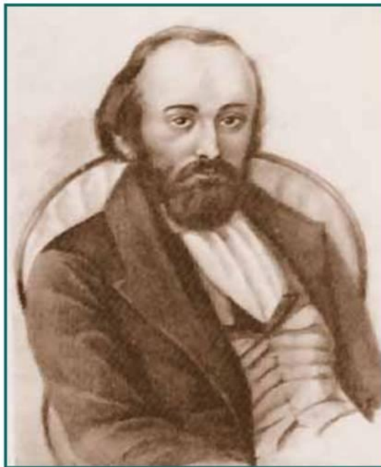
Михаил Васильевич Петрашевский

Молодой писатель – страстный политический мечтатель