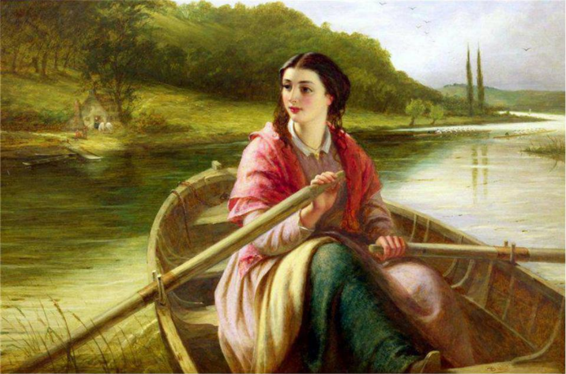
Юрий Весняк «Баркарола»