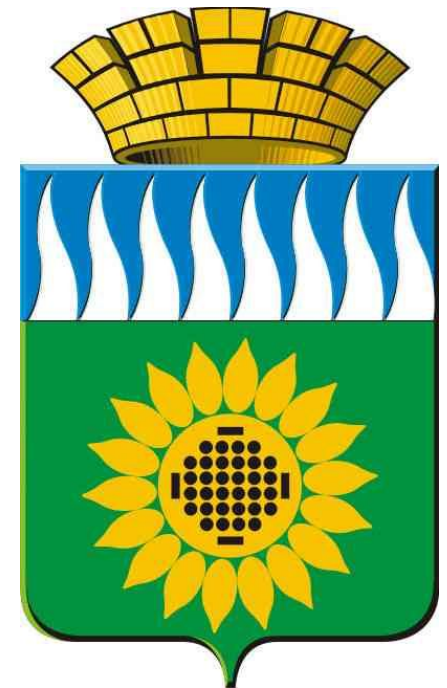
Свердловская область. Герб города Заречный