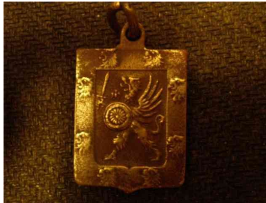
Фамильный герб дома Романовых. Найден на Нарове.