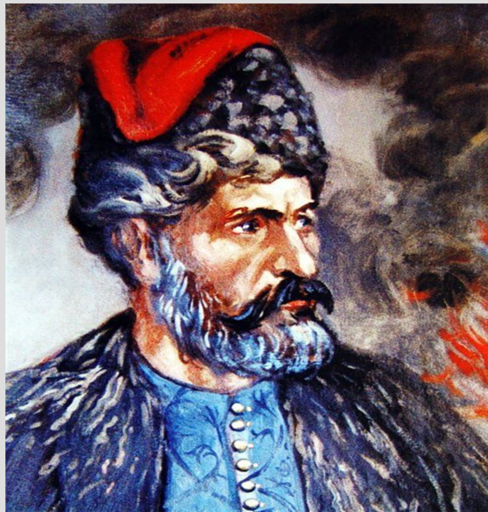
Кондратий Афанасьевич Булавин.