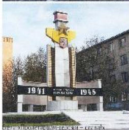
Мемориал в честь героев — защитников Тулы