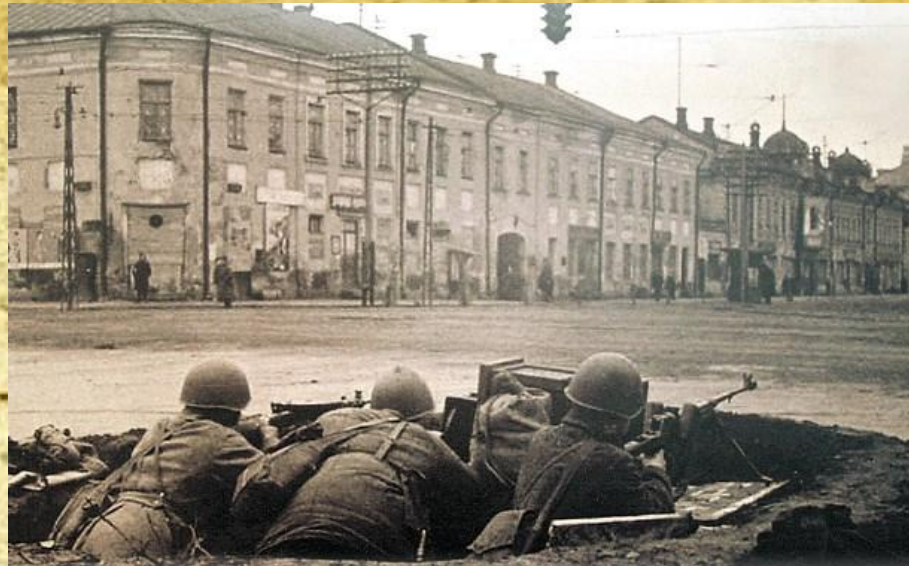
Перекресток ул. Советской и ул. Коммунаров (пр. Ленина). Октябрь 1941 г.

Официальной датой начала героической обороны Тулы считается 29 октября 1941 года . Около 10 утра немцы начали артобстрел и авиаудары позиций защитников Тулы. Затем со стороны Щекино пошел в атаку немецкий танковый полк (около 100 танков) и два батальона пехоты.