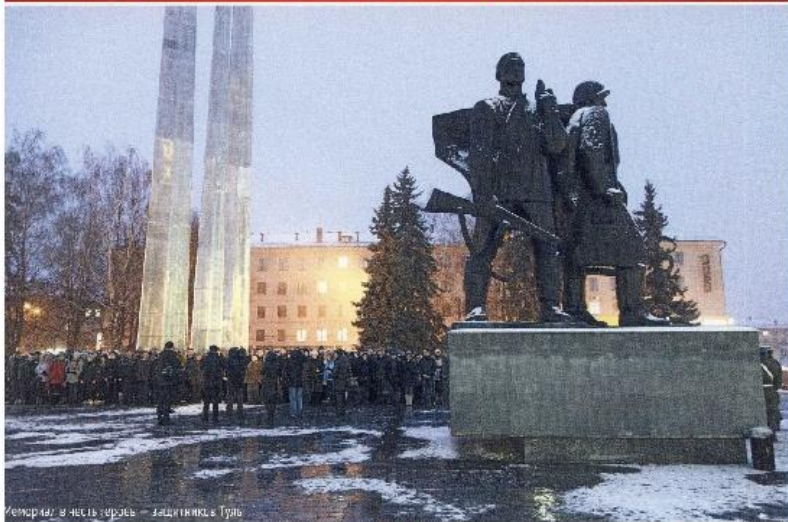
Мемориал в честь героев — защитников Тулы