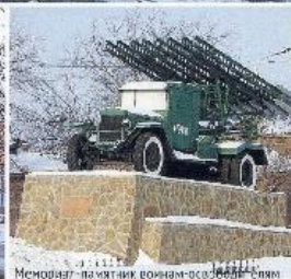
Мемориал в честь героев — защитников Тулы

За мужество и стойкость, проявленные защитниками Тулы при героической обороне города, сыгравшую важную роль в разгроме немецко-фашистских войск под Москвой в период Великой Отечественной войны, присвоить городу Туле почетное звание «Город-герой».