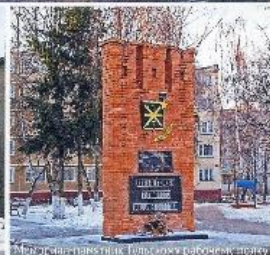
Мемориал в честь героев — защитников Тулы