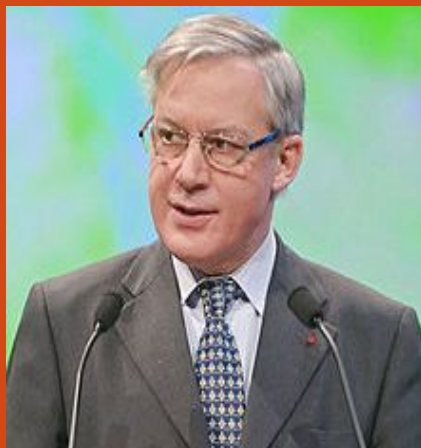
Кристиан Нойер (1993-1997)