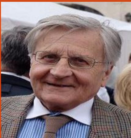
Жан-Клод Трише (1985-1993)