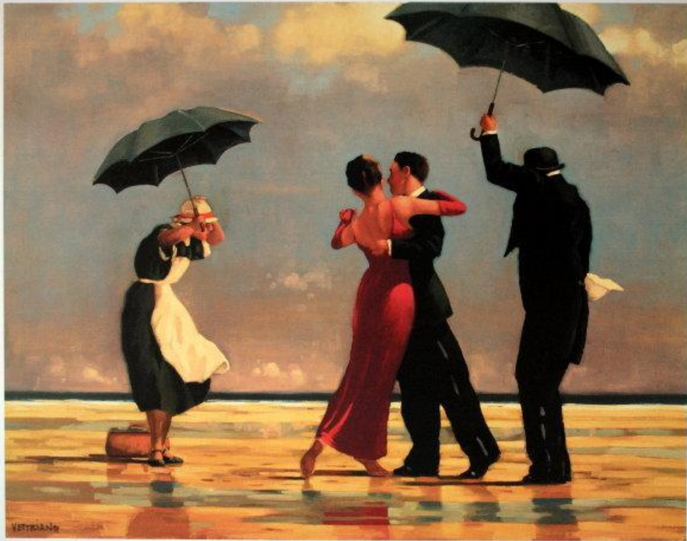
JACK VETTRIANO • Portland Gallery