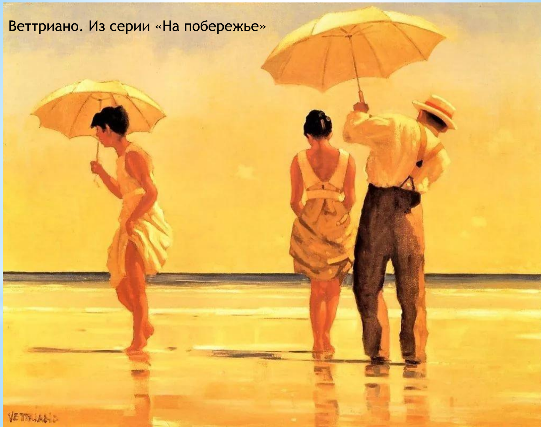
Веттриано. Из серии «На побережье»