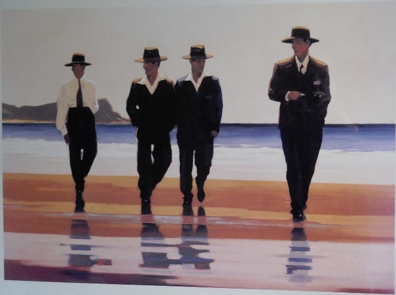
JACK VETTRIANO Portland Gallery