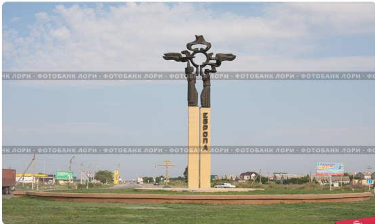
Ставропольский край, город Нефтекумск. Стела "Европа-Азия"