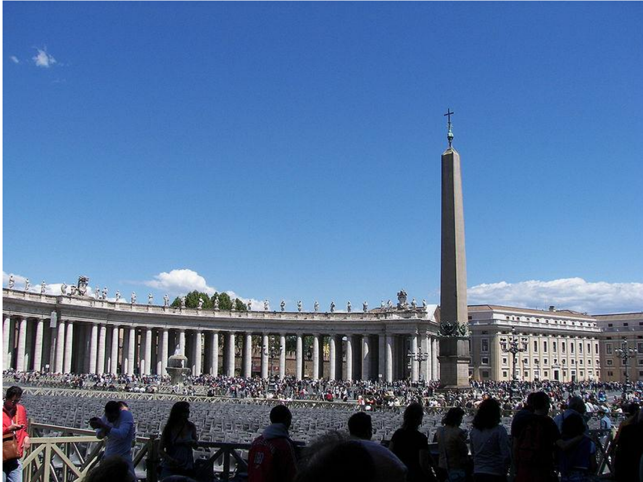
Колоннада на площади Святого Петра