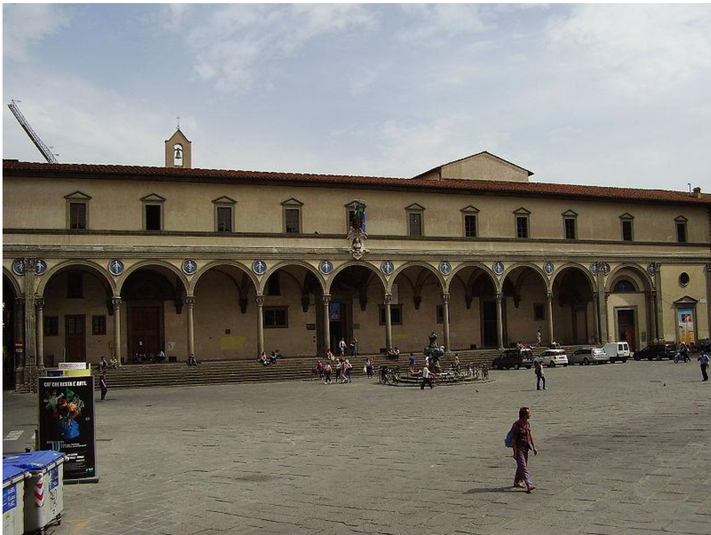
Приют во Флоренции (П-образной формы)