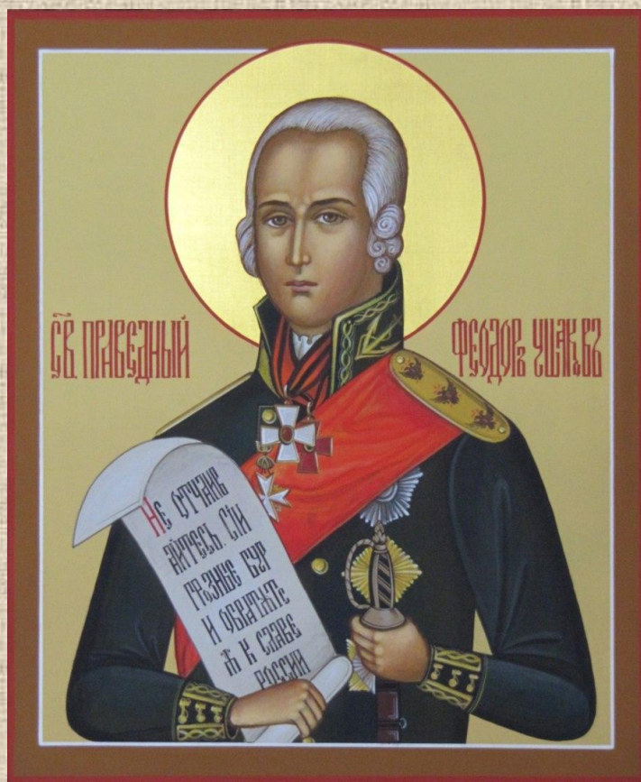
Икона святого праведного воина Федора Ушакова