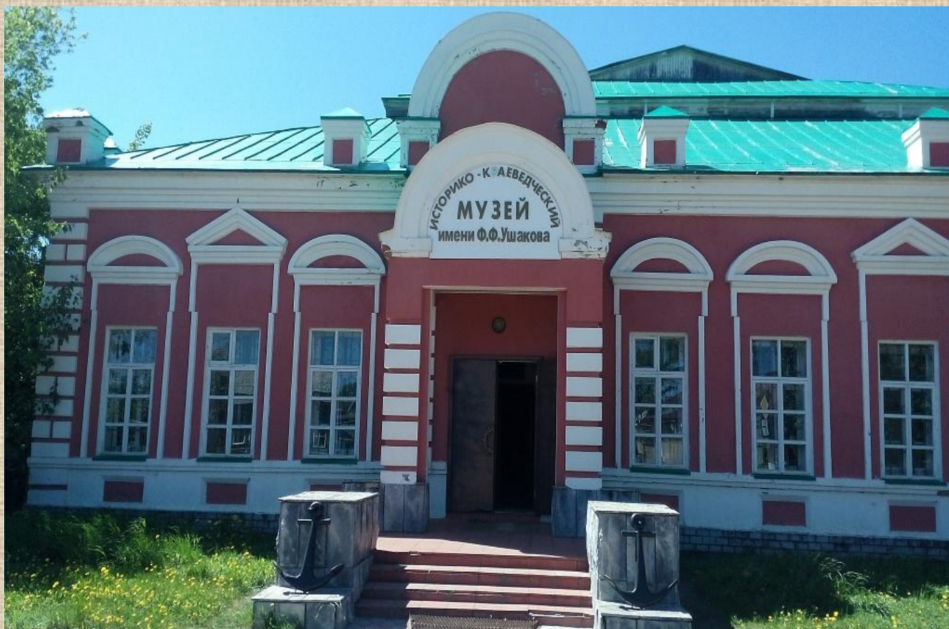
Темниковский историко-краеведческий музей имени Ф.Ф. Ушакова