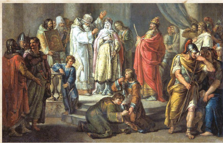
Крещение княгини Ольги в Константинополе. Художник Иван Акимов.