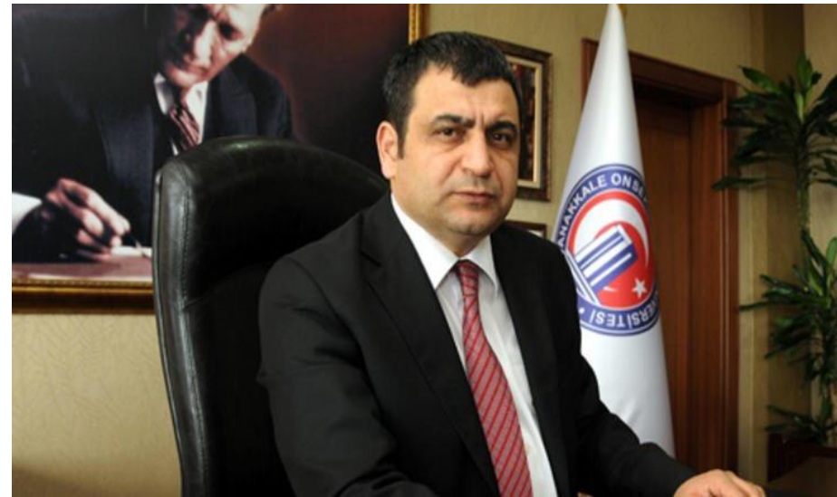
Профессор д-р Седат Лачинер,

Данный аналитический центр считает, что изучение международных отношений «страдает от ограниченного понимания на Западе и нуждается в разных подходах». Он описывает себя как либерально-националистический центр.