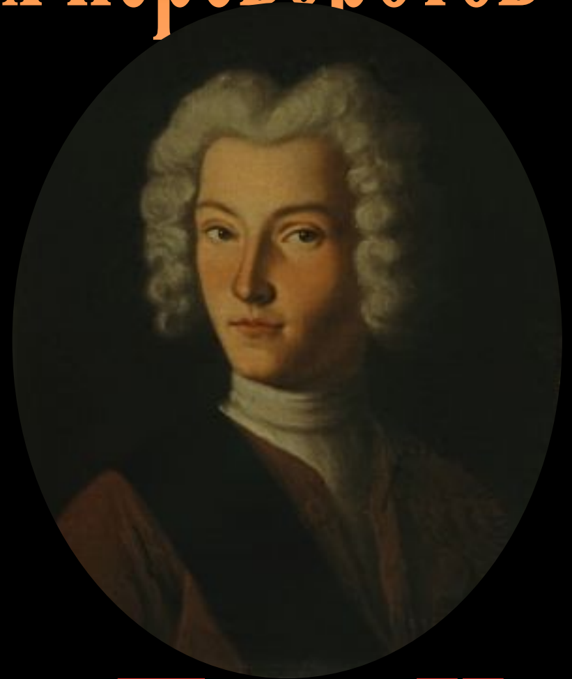
Петр II (1727 – 1730)