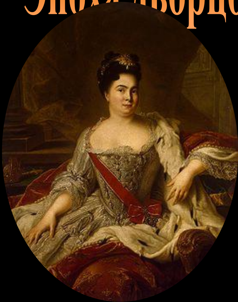
Екатерина I (1725-1727)