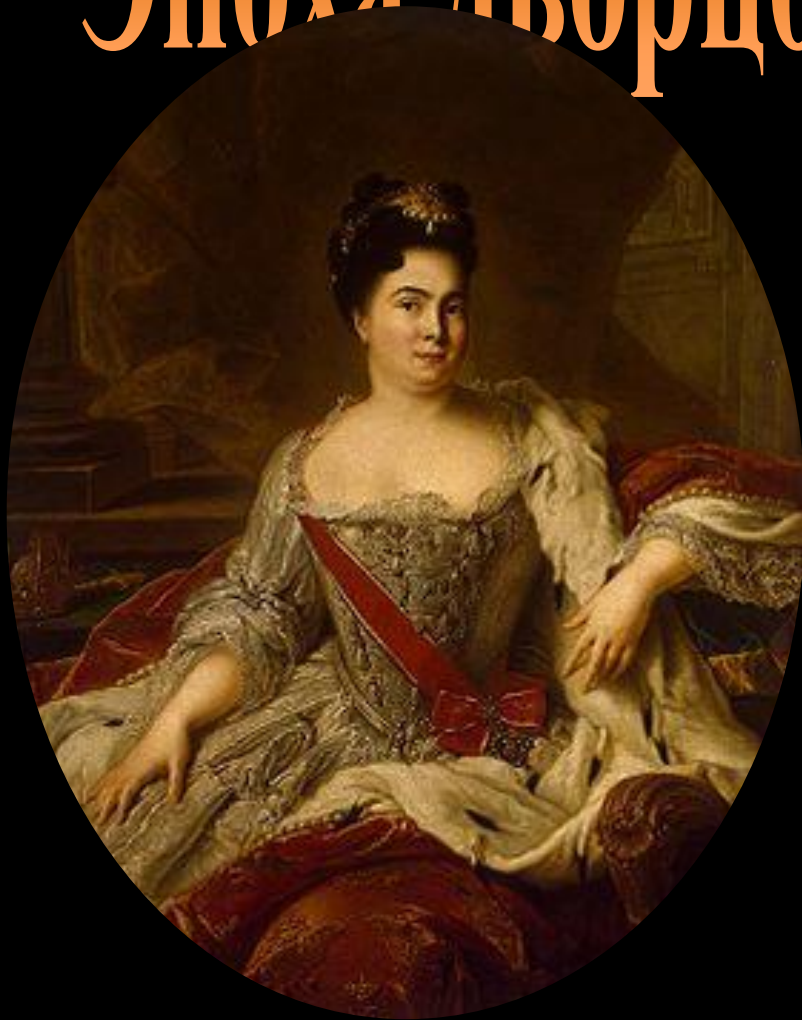
Екатерина I (1725-1727)