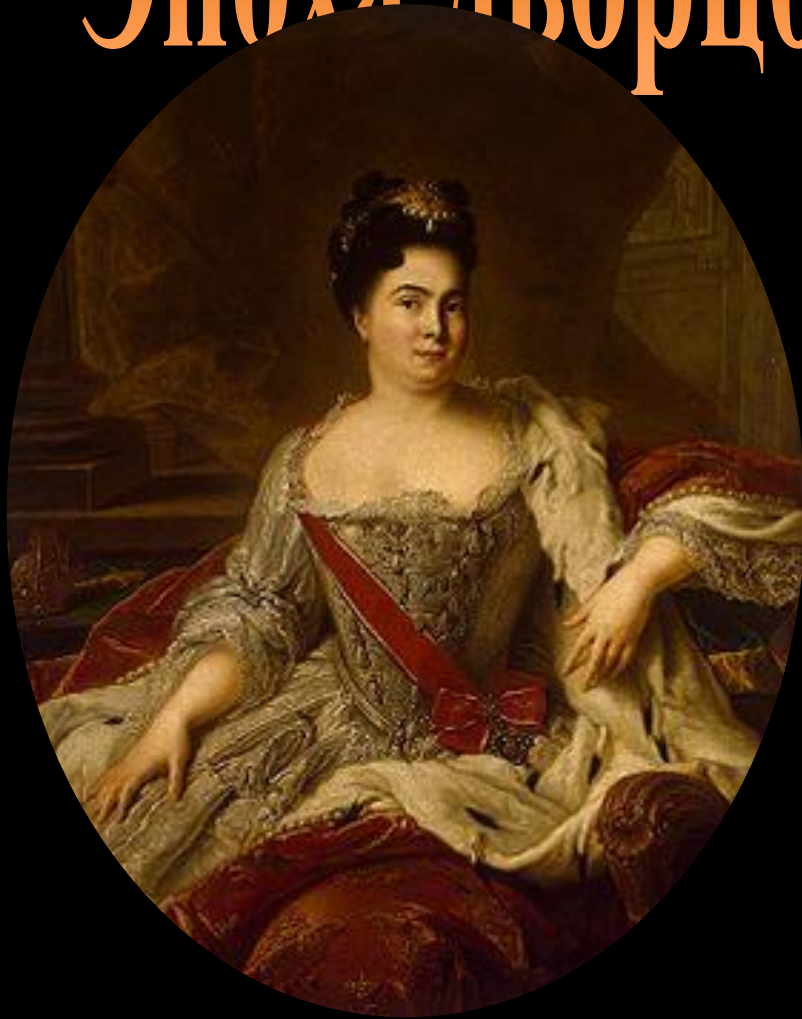
Екатерина I (1725-1727)