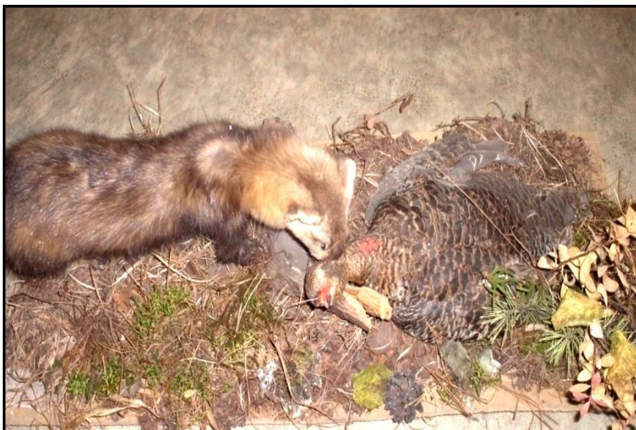
Чучело соболя и тетерева