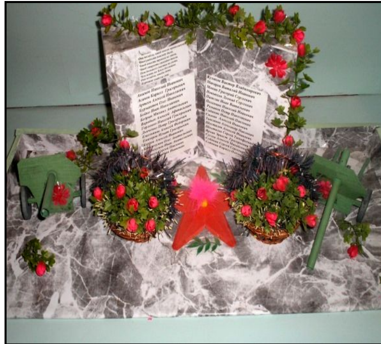
Макет обелиска в п. Ванзетур