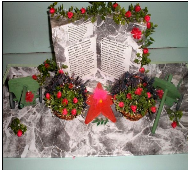
Макет обелиска в п. Ванзетур