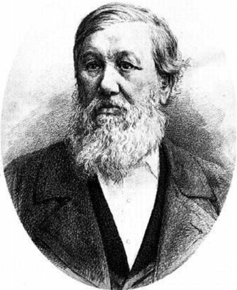
Данилевский Николай Яковлевич