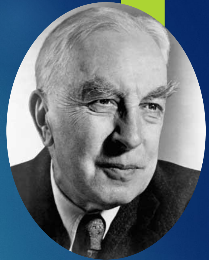
Арнольд Джозеф Тойнби

XX ғ. өркениеттік тәсіл неміс философы О.Шпенглер (1880-1936) мен ағылшын саясаттанушысы А.Тойнби (1889-1975) еңбектерімен әрі қарай дамытылды. О.Шпенглер өзіне тән саяси ұйымдары бар 9 жергілікті мәдениетті көрсетеді. Ал, А.Тойнби 21 кейінірек, 13 аймақтық мәдениетті көрсетеді.