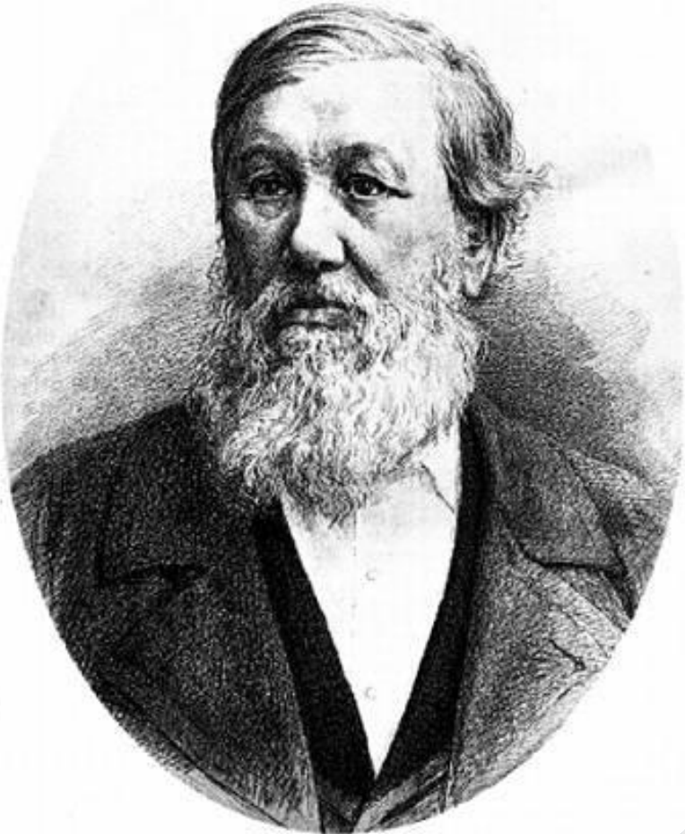
Данилевский Николай Яковлевич