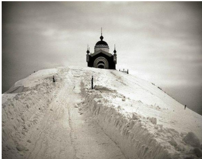
Никольская церковь на Белой горе

Возвышается она неподалёку от р.п. Сурское, на берегу реки Суры. Именно здесь ежегодно в майские дни проходят празднования в честь Святителя Николая Угодника. Раньше она была известная под названием белая Гора, так как состоит из меловой опоки и почти лишена растительности. Высота ее достигала 76 м. На белой горе располагался один из первых сторожевых дозоров, успешно отражавших набеги кочевников.