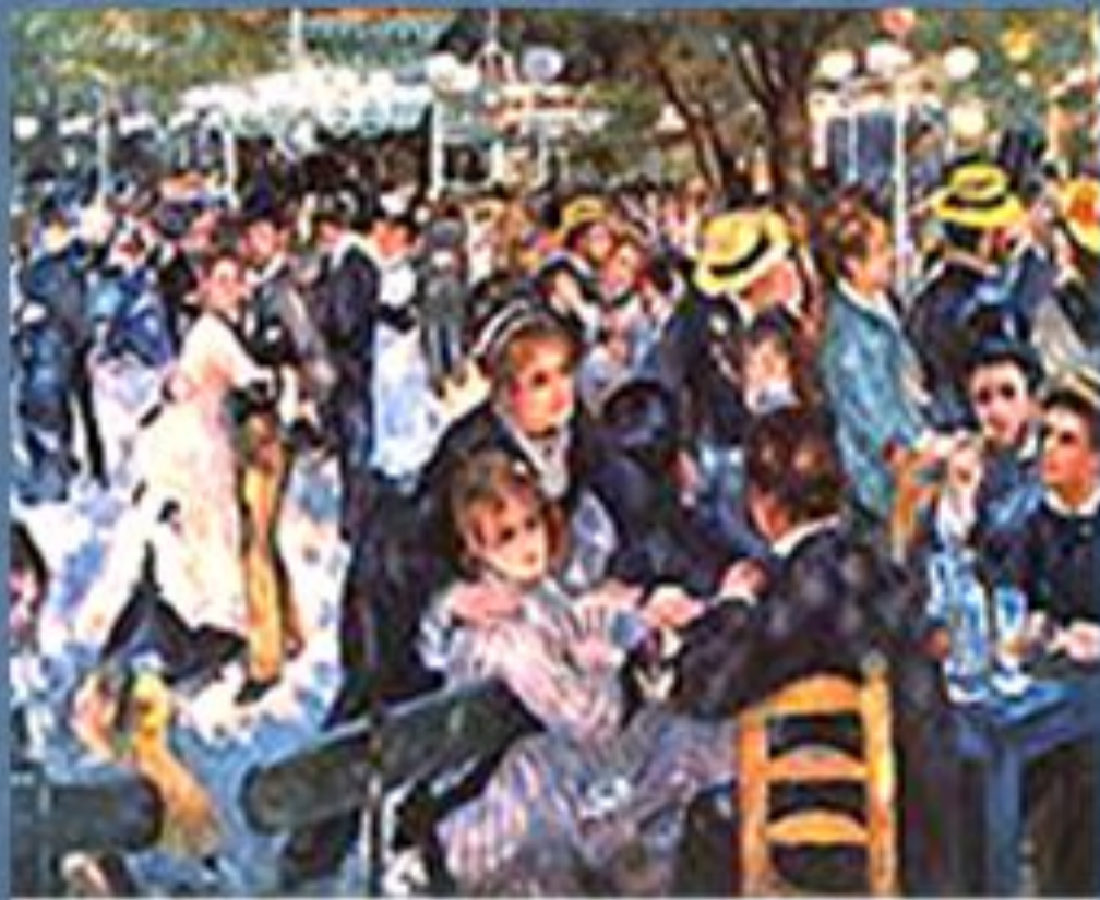
«Бал в Мулен де ла Галет». 1876.