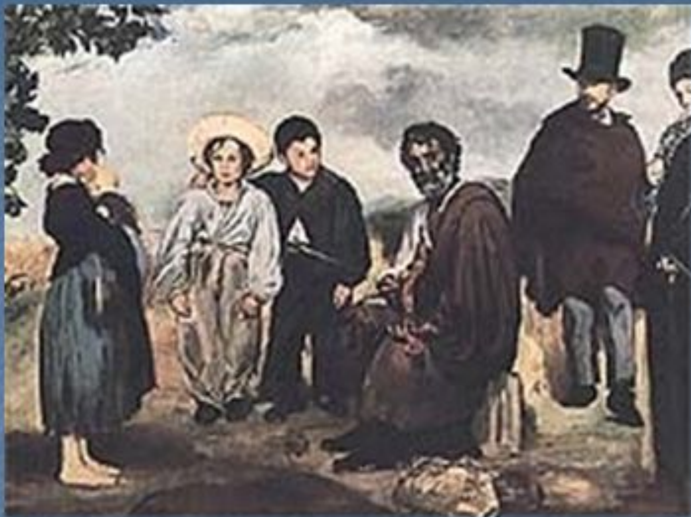
«Старый музыкант». 1862 год.