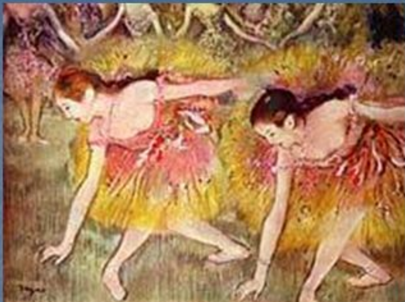
Танцовщицы на поклонах