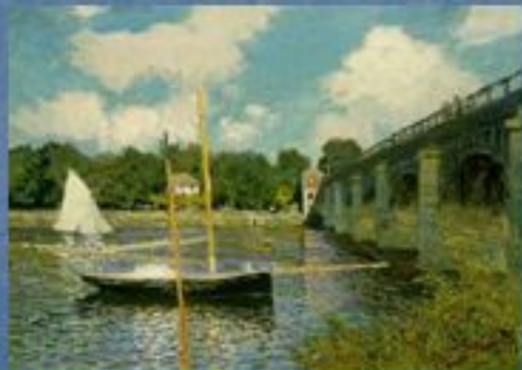
«Регата в Аржантее»

Одержимость Моне светом и цветом вылилась в многолетние исследования и эксперименты, целью которых было зафиксировать на холсте мимолетные, ускользающие оттенки природы.