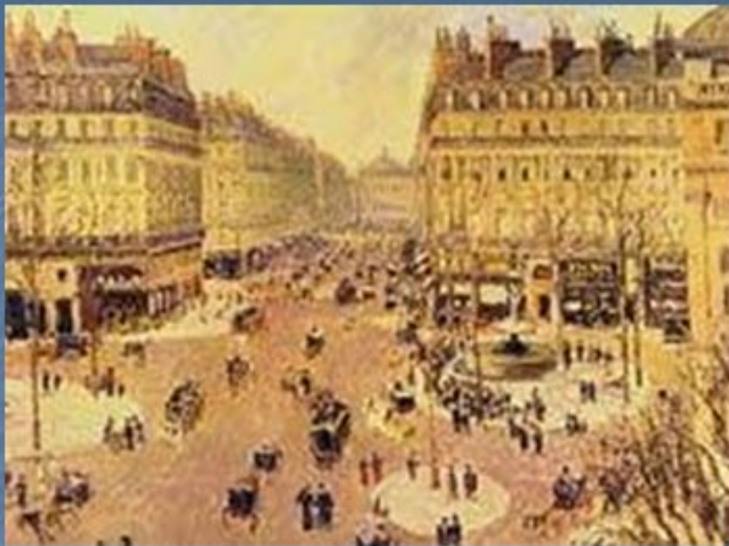
Оперный проезд в Париже».