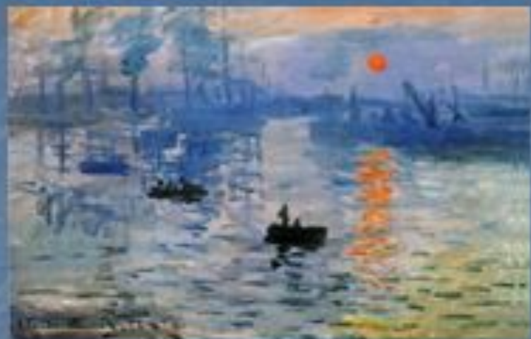
«Впечатления. Восход солнца.»