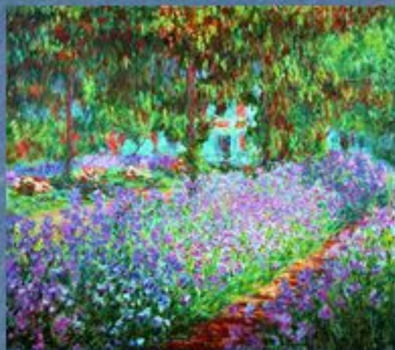
«Сад художника в Живерни»

Она представляла собой не гладкое письмо, с помощью тонких лессировок (так пишут ателье живописцев), а состояла из пастозных мазков.