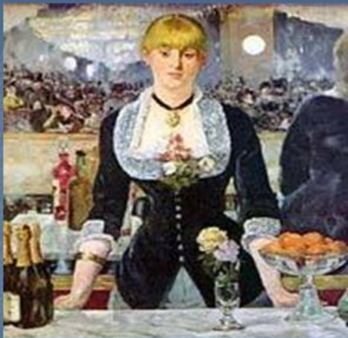
Бар в Фоли-Бержер.