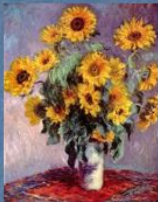
«Натюрморт с подсолнухами»