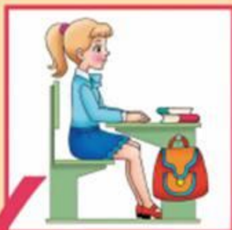
Посадка «готов к работе»