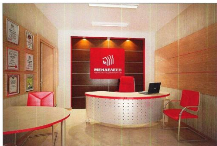
Визуализация приемной кадр 1