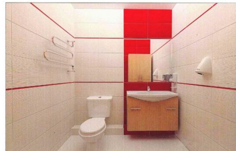
Санузел кадр 2