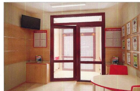
Визуализация приемной кадр 2