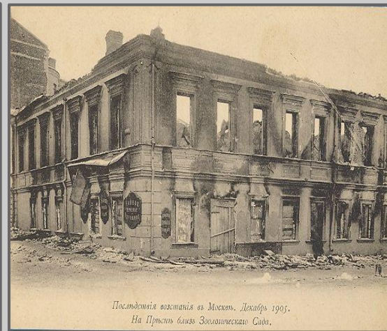
Последствия боев. Останки дома на Пресне в районе зоопарка.