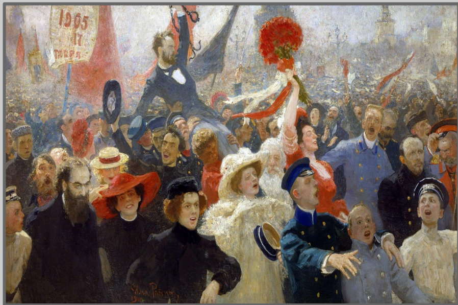
Илья Репин 17 Октября 1905

Историческое значение Манифеста заключалось в распределении прежде единоличного права Российского Императора законодательствовать между собственно монархом и законодательным (представительным) органом — Государственной Думой.