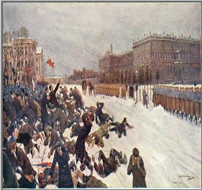
Иван Владимиров Расстрел рабочих 9 января 1905 года.

События "кровавого воскресенья" потрясли всю Россию. Портреты царя, прежде чтимые как святыни, рвали и топтали прямо на улицах. Потрясенный расстрелом рабочих Г. Гапон воскликнул: "Нет больше Бога, нету больше царя!" В ночь после "кровавого воскресенья" он написал листовку: