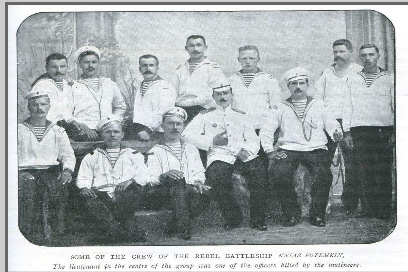
SOME OF THE CREW OF THE REBEL BATTLESHIP KNIAZ POTEMKIN. The lieutenant in the centre of the group was one of the officers killed by the mutineers.

Броненосец «Князь Потёмкин Таврический» был на тот момент самым новым и одним из сильнейших кораблей Черноморского флота России. Постройка корабля шла дольше запланированного из-за произошедшего во время постройки пожара в котельном отделении и обнаруженных дефектов брони башен орудий главного калибра. Незадолго до описываемых событий корабль успешно прошёл ходовые испытания и приступил к испытанию вооружения.