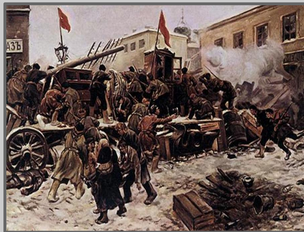
Иван Владимиров. Баррикады на Пресне

Восстание вызвало многочисленные человеческие жертвы среди мирного населения Москвы — погибло как минимум 580 ни в чём не повинных москвичей, 14 московских дворников и 36 московских полицейских, среди горожан было много раненых. Была нарушена нормальная функция городского хозяйства, осложнен подвоз продовольствия и топлива в город, серьёзный ущерб причинен имуществу города и граждан — несколько десятков жилых, производственных и общественных зданий сгорело или было разрушено в ходе боев, многие улицы лишились разобранного для строительства баррикад дорожного покрытия — булыжного камня, освещения, телефонной связи. Всё это — среди суровой московской зимы.