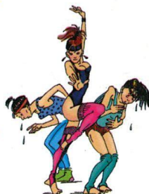
Интенсивные спортивные тренировки