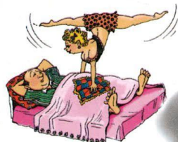
Мифы о преклонном возрасте