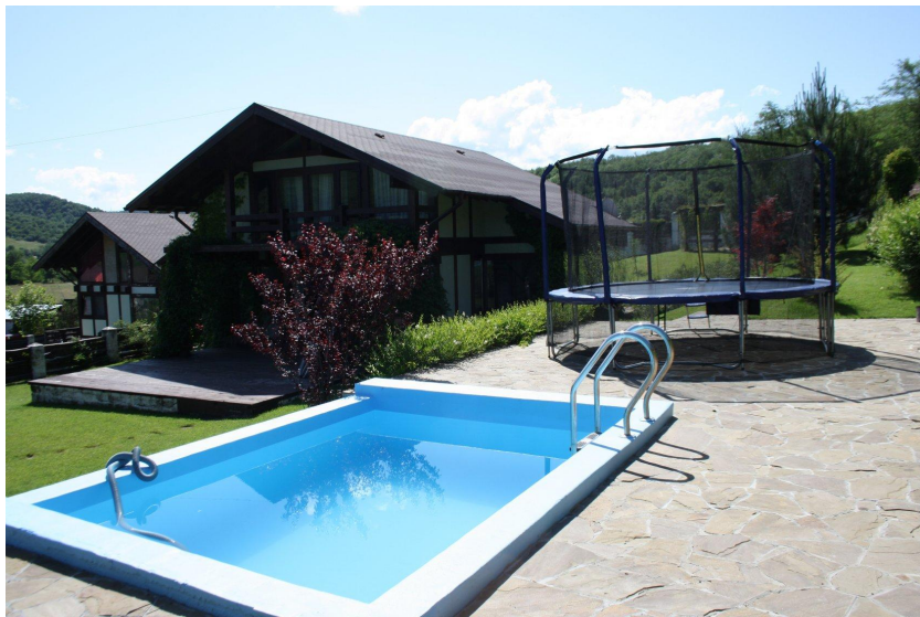
Терраса с видом на горы и лес

160 квадратных метров тишины и уюта в Бельбекской долине у отрогов Крымских гор