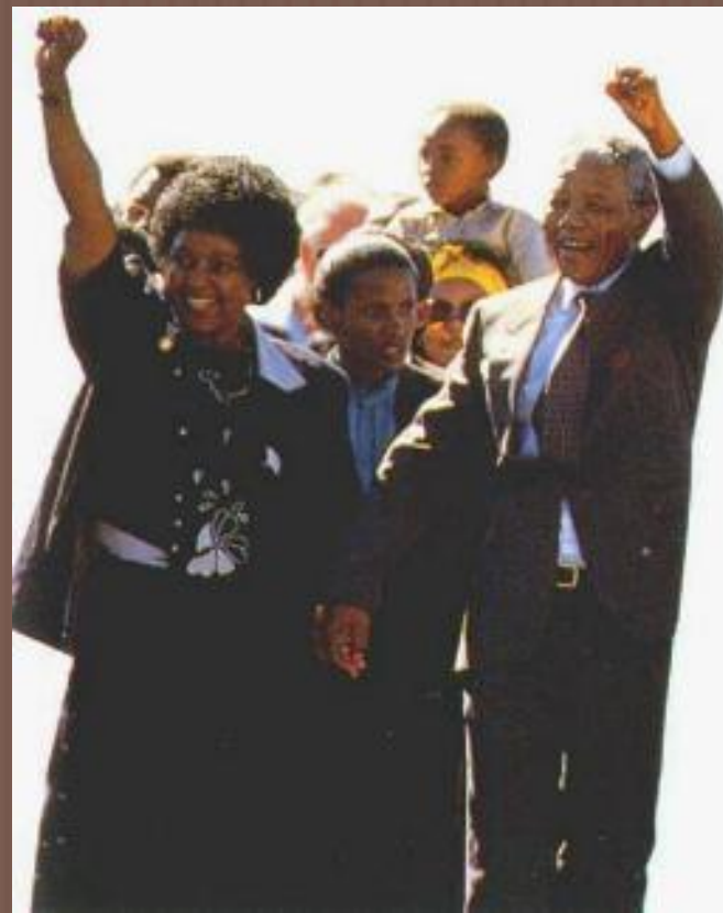
Нельсон и Винни Мандела.

В 1975Г. РУХНУЛА КОЛОНИАЛЬНАЯ ИМПЕРИЯ ПОРТУГАЛИИ: АНГОЛА И МОЗАМБИК ДОБИЛИСЬ НЕЗАВИСИМОСТИ. 1990Г. – ОСВОБОДИЛАСЬ НАМИБИЯ . В СВЯЗИ С РАСПАДОМ КОЛОНИАЛЬНОЙ ИМПЕРИИ ПОЯВИЛОСЬ БОЛЕЕ 100 НОВЫХ ГОСУДАРСТВ, В КОТОРЫХ ПРОЖИВАЛО БОЛЕЕ 2 МЛРД ЧЕЛ