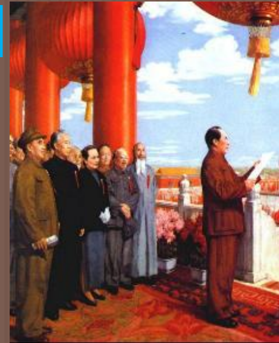
Мао Цзэдун провозглашает КНР