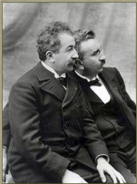
Братья Луи и Огюст Люмьер

Официально считается, что кинематограф берёт своё начало 28 декабря 1895 года. В этот день в индийском салоне «Гран-кафе» на бульваре Капуцинов состоялся публичный показ «Синематографа братьев Люмьер».