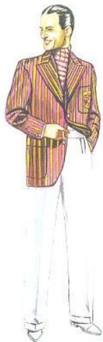
Одежда для прогулок 1934 год