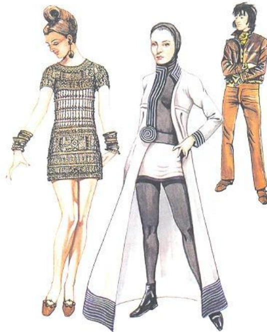
Мужской и женский стиль 1969 год