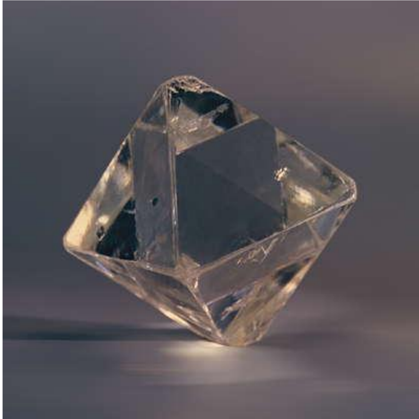
Алмаз в форме октаэдра