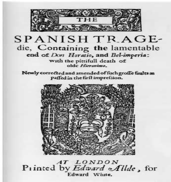
Ил. 1. Титульный лист первого издания «Испанской трагедии» (1592?)