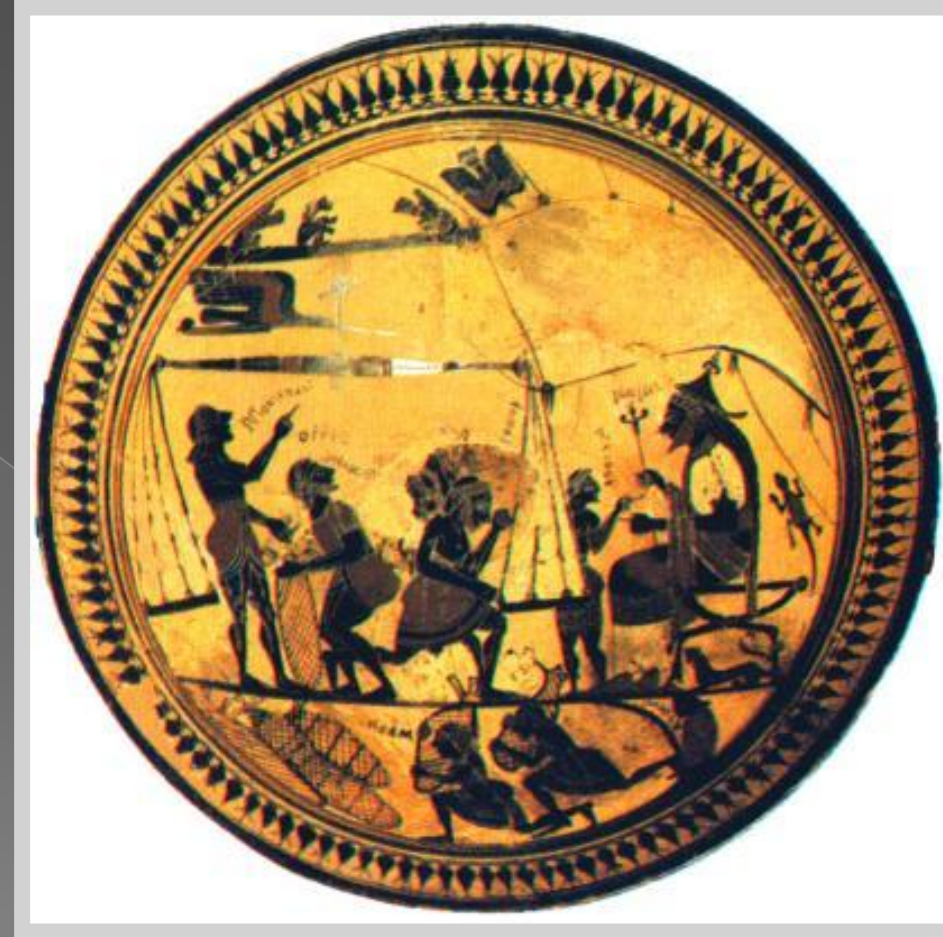
Разгрузка торгового корабля.