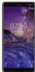
Nokia 7 Plus