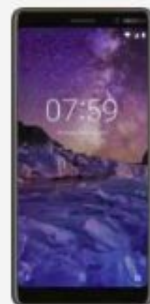
Nokia 7 Plus