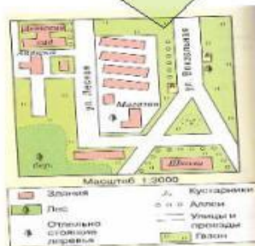
Рис. 24. План населённого пункта

Условные знаки плана отличаются от условных знаков карты.