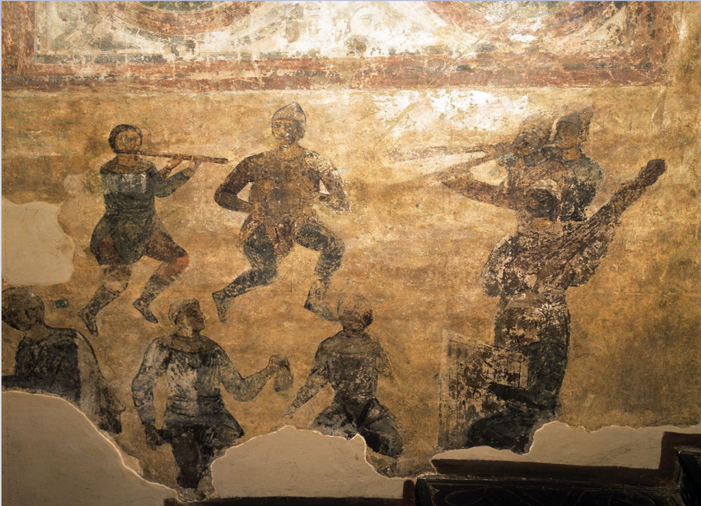
Фреска «Акробаты и скоморохи»