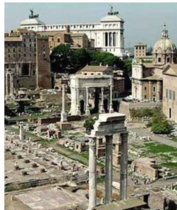
Развалины форума в Риме

Колизей - один из знаменитых древних памятников древнего Рима. Строительство велось на протяжении 5 лет, с 75-80 гг.