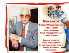
Михалков Сергей Владимирович (1913 - 2009) Почетный доктор Академии Государственного искусства России