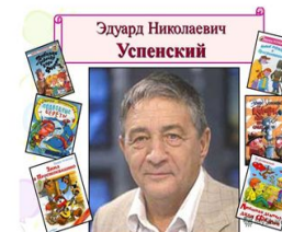
Эдуард Николаевич Успенский