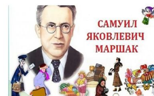
САМУИЛ ЯКОВЛЕВИЧ МАРШАК