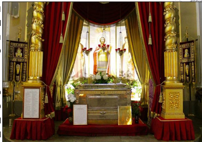
Мощи Александра Невского Троицкий собор Александро- Невской Лавры