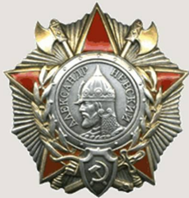
Орден Александра Невского

Орден Александра Невского учрежден Указом Президиума Верховного Совета СССР от 29 июля 1942 года. Имеет одну степень. Орденом Александра Невского награждаются командиры Красной Армии, проявившие в боях за Родину в Отечественной войне личную отвагу, мужество и храбрость и умелым командованием обеспечившие успешные действия своих частей.