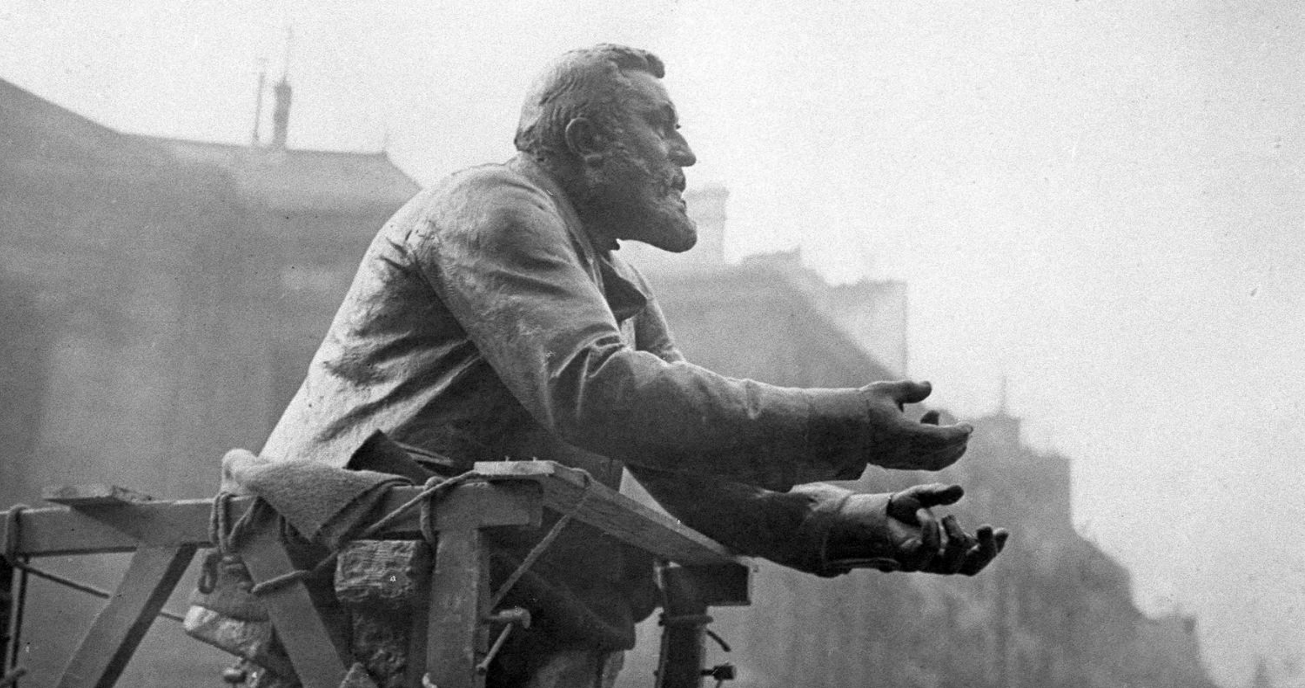
Жан – Жорес пацифист жертва Первой Мировой войны (застрелен )