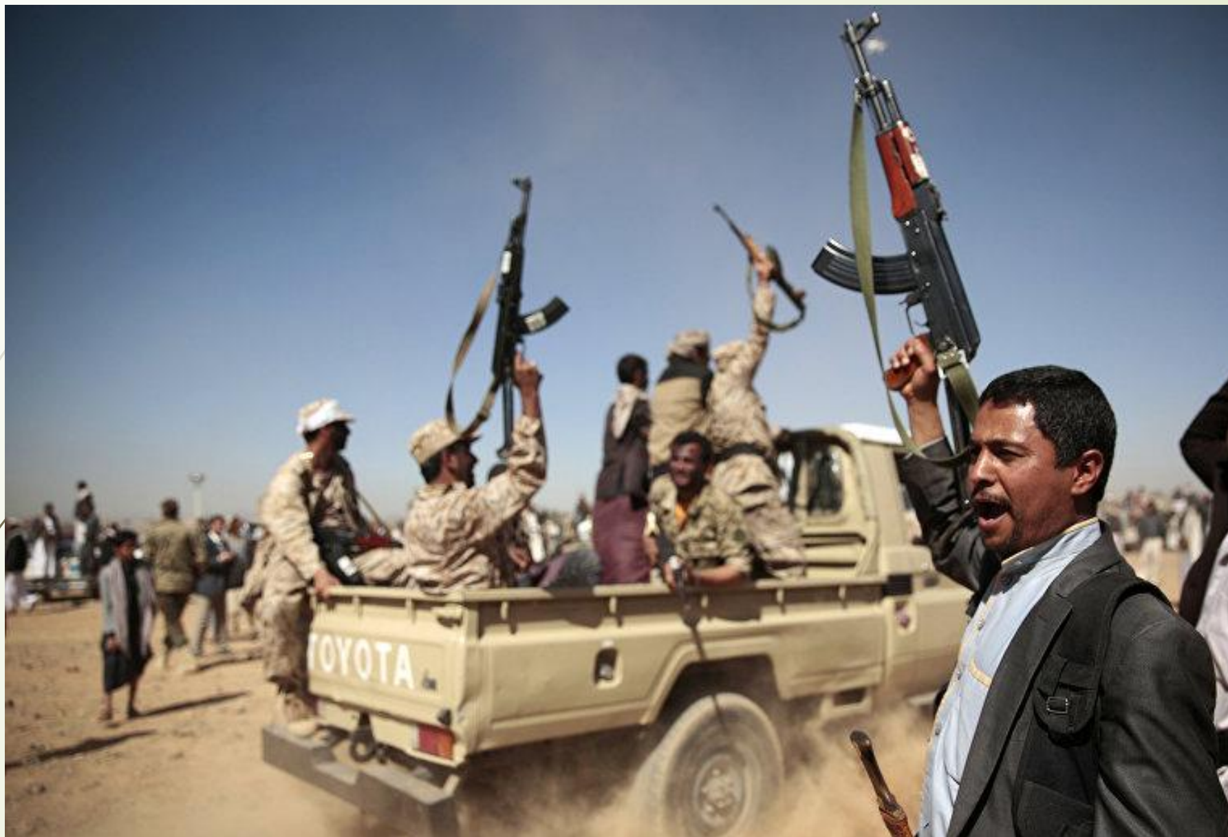
Гражданская война в Йемене 2014