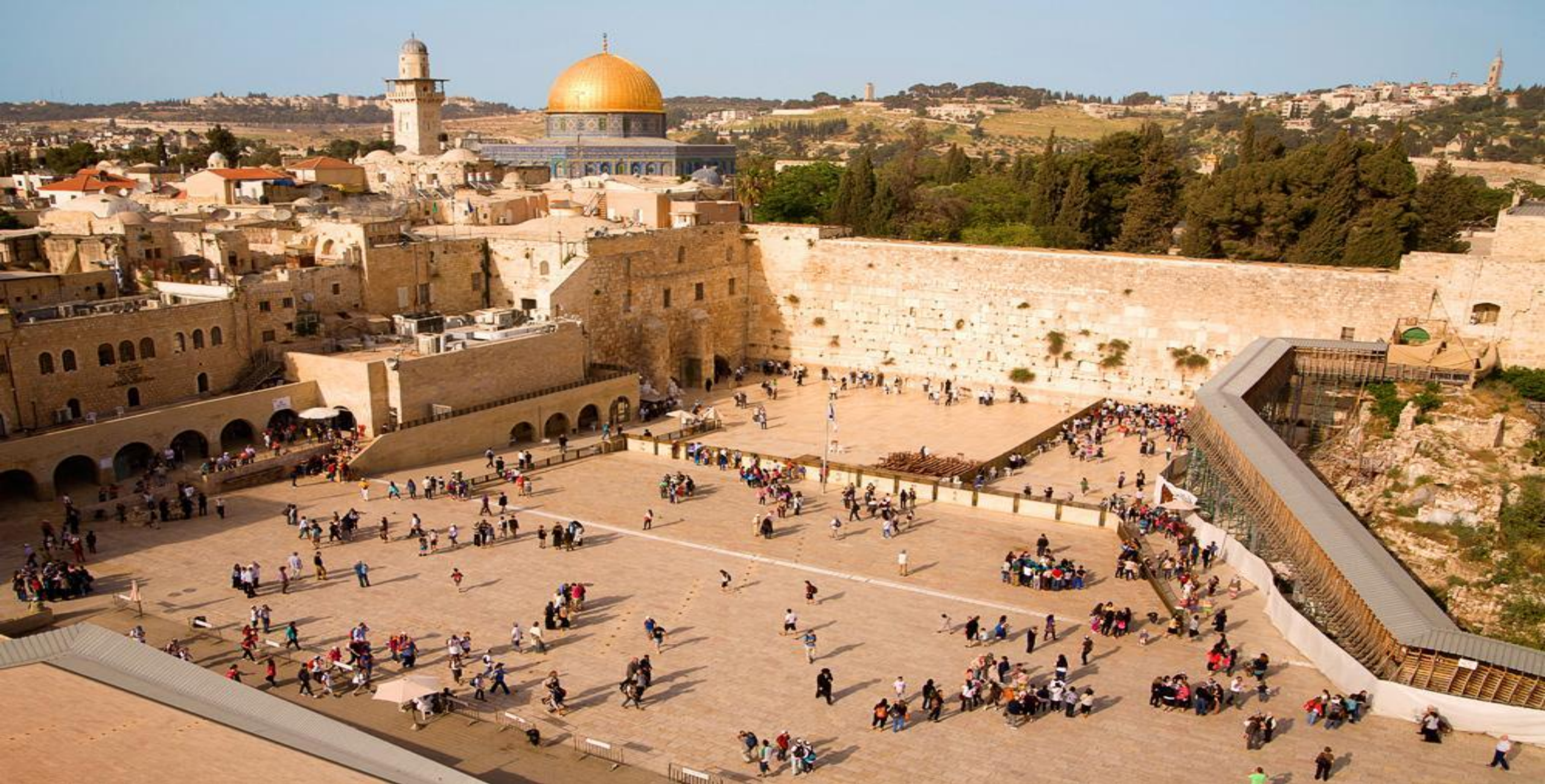
Стена Плача - Иерусалим