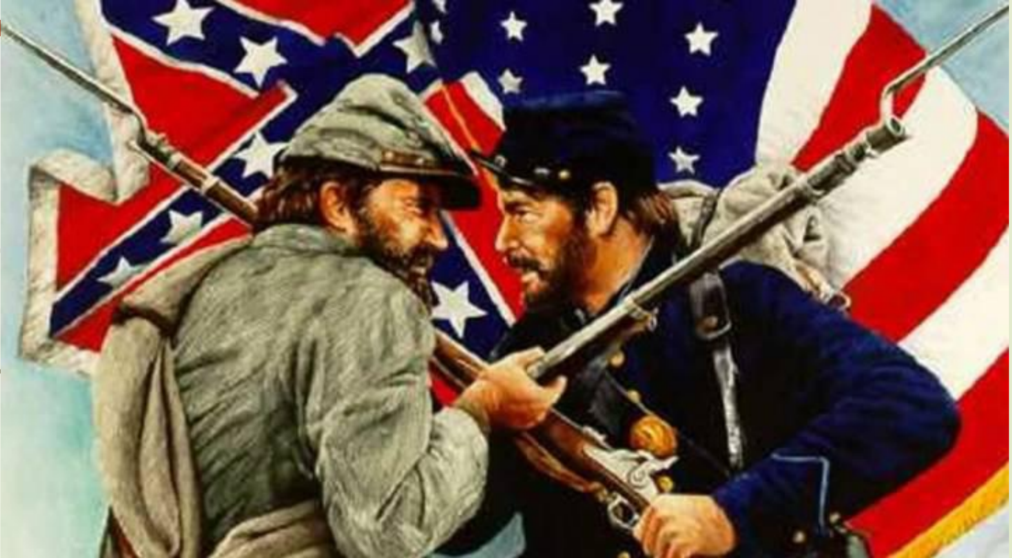
Война Север и Юг США 12 апр. 1861 г. – 13 мая 1865 г.