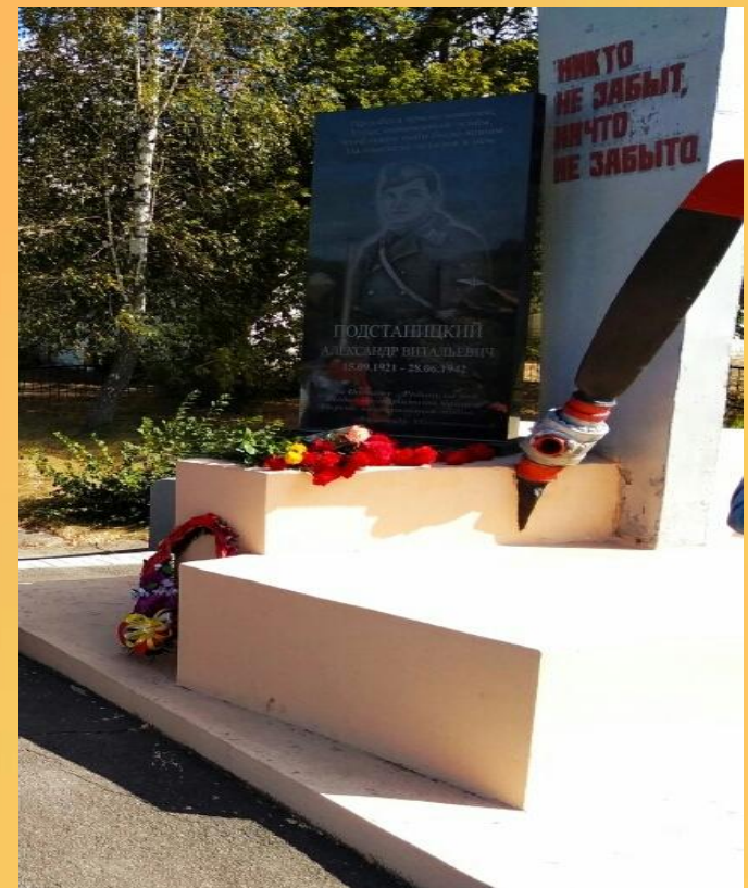
Мемориальная плита на месте гибели лётчика Подстаницкого в деревне Росстани Орловской области.