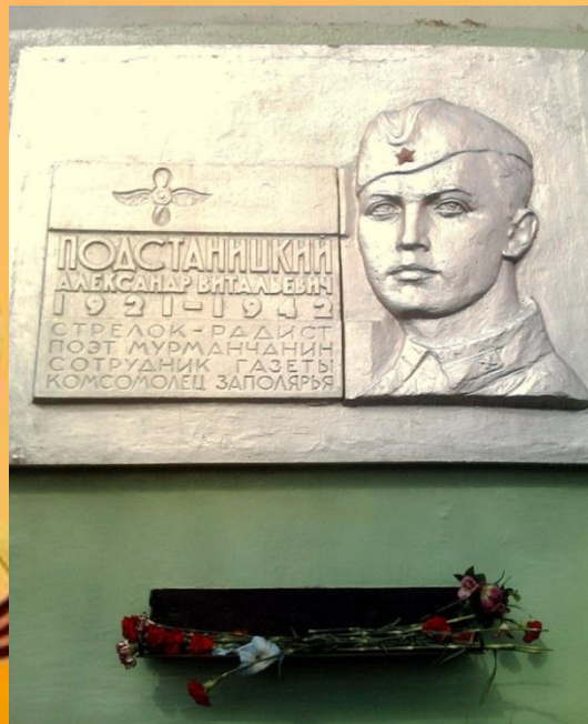
Мемориальная доска в Мурманске на доме № 8 по улице, названной именем Александра Подстаницкого.