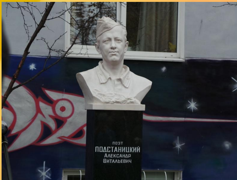
Бюст на Аллее писателей у Мурманской областной детско-юношеской библиотеки.