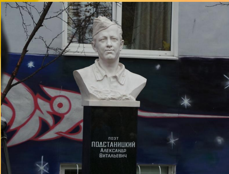
Бюст на Аллее писателей у Мурманской областной детско-юношеской библиотеки.