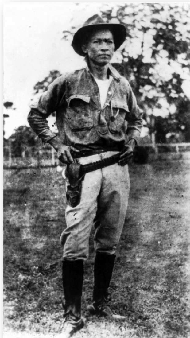
Аугусто Сесар Сандино