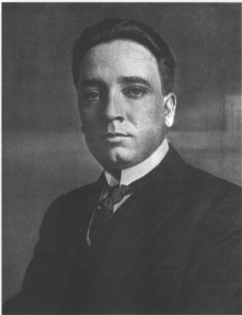
Бальтасар Брум – президент Уругвая.