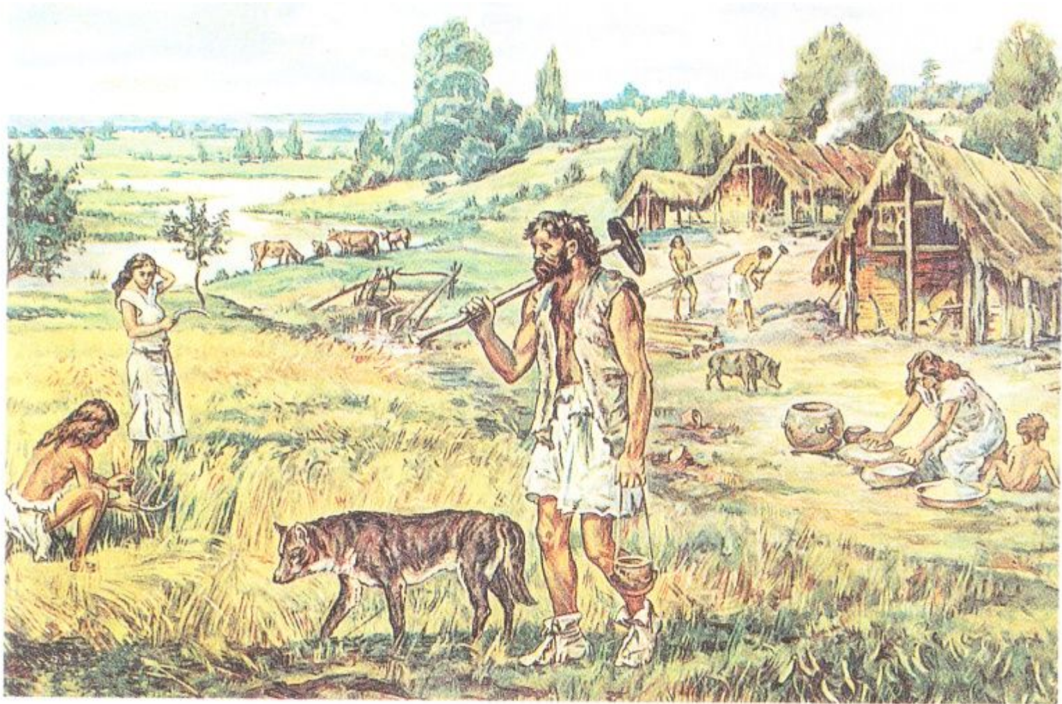
Женский и мужской труд