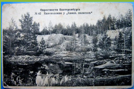
Окрестности Екатеринбурга № 42 Каменнолопья у „Камен. палаток“

Каменные платки Шарташа вошли в Топ 15 красивейших мест России. Вблизи Шарташа находятся не только археологические объекты датируемые от каменного века до средневековья, но и те которые являются яркими страницами истории Урала и самой России последних веков.