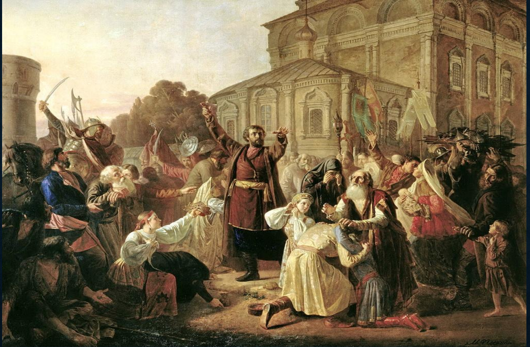
«Воззвание Минина к нижегородцам в 1611 году»,