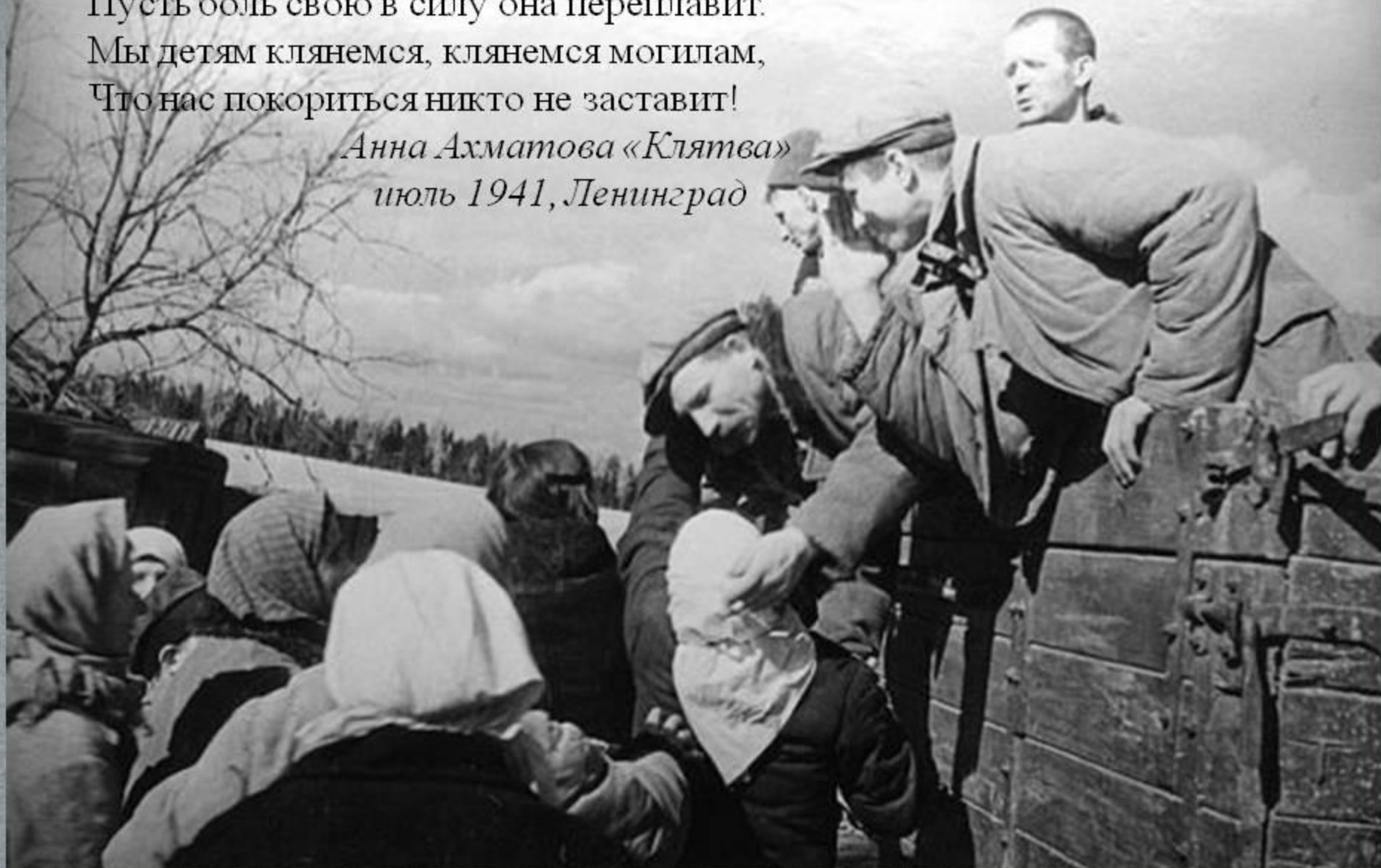
Проводы на фронт, 1941 год

Анна Ахматова «Клятва» июль 1941, Ленинград