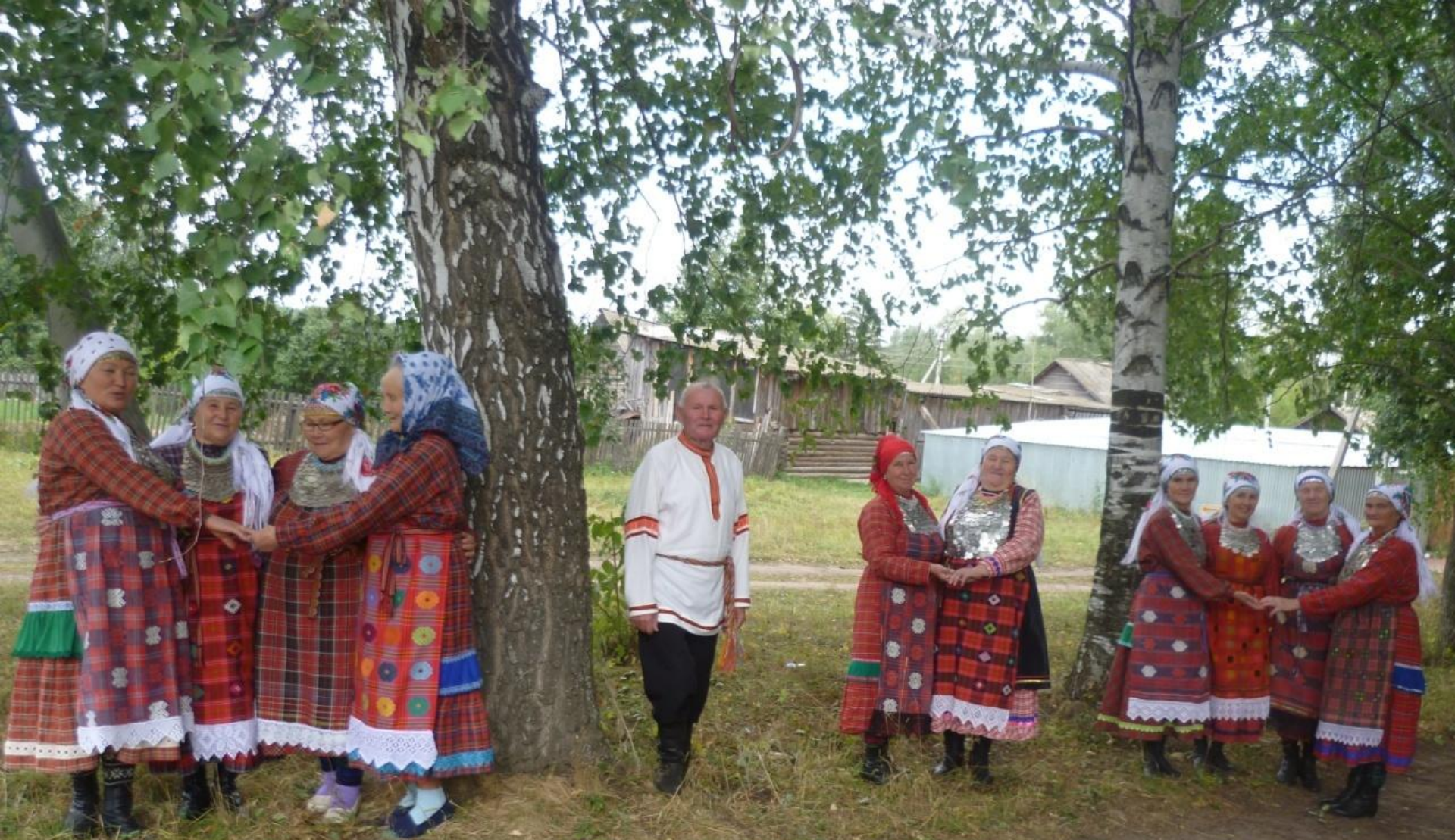
Ансамбль калык кырзандысты но эктондысты, сым-йылолудысты гажасы гуртоосты огазез