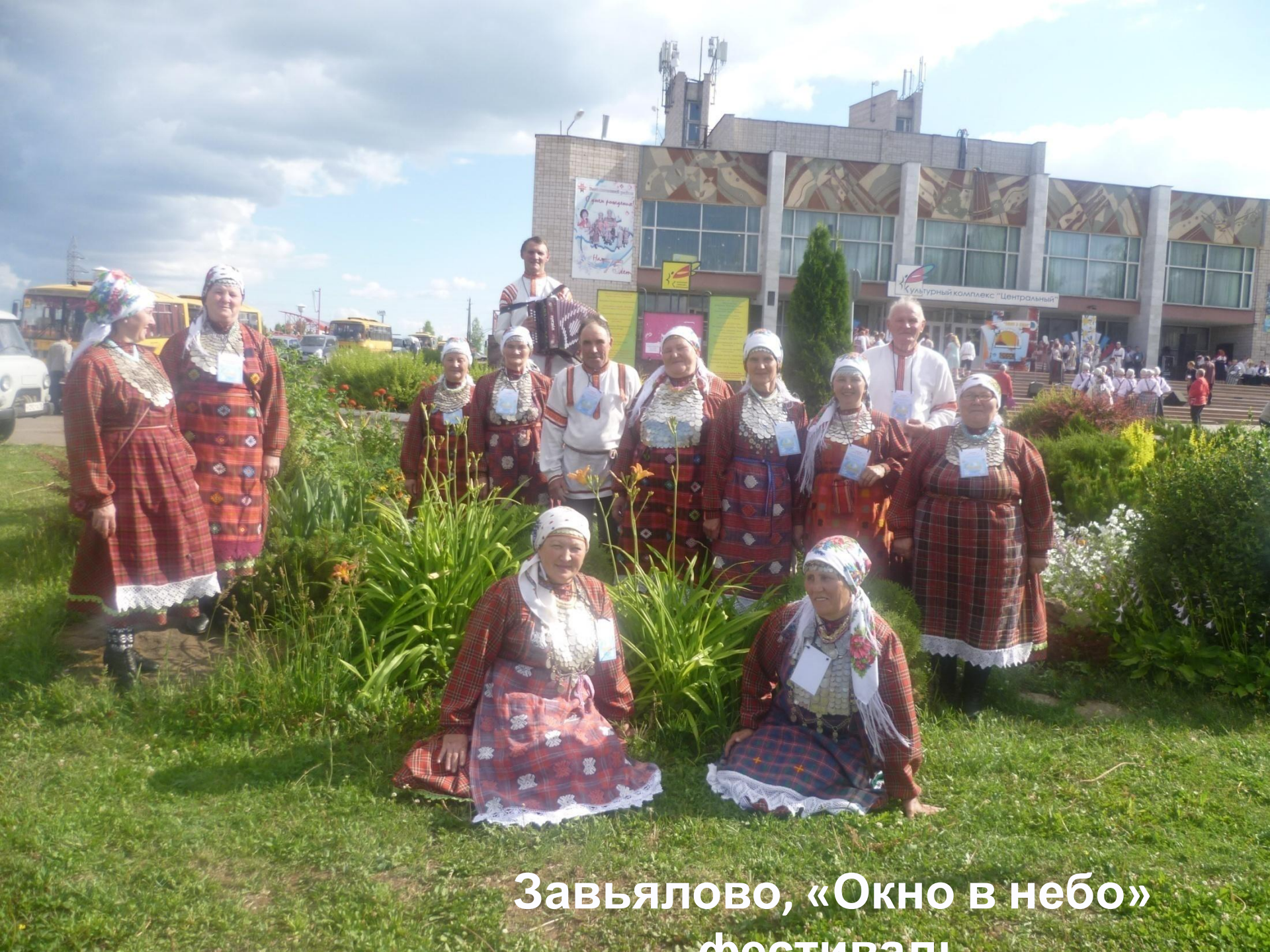
Завьялово, «Окно в небо» фестивали