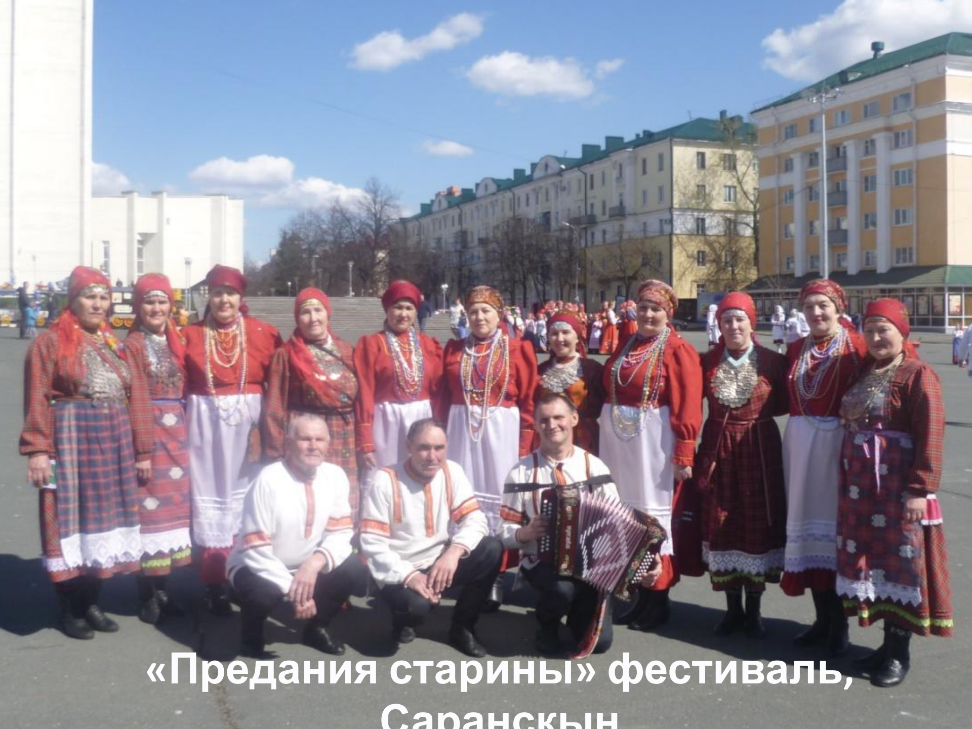
«Предания старины» фестиваль, Саранскын