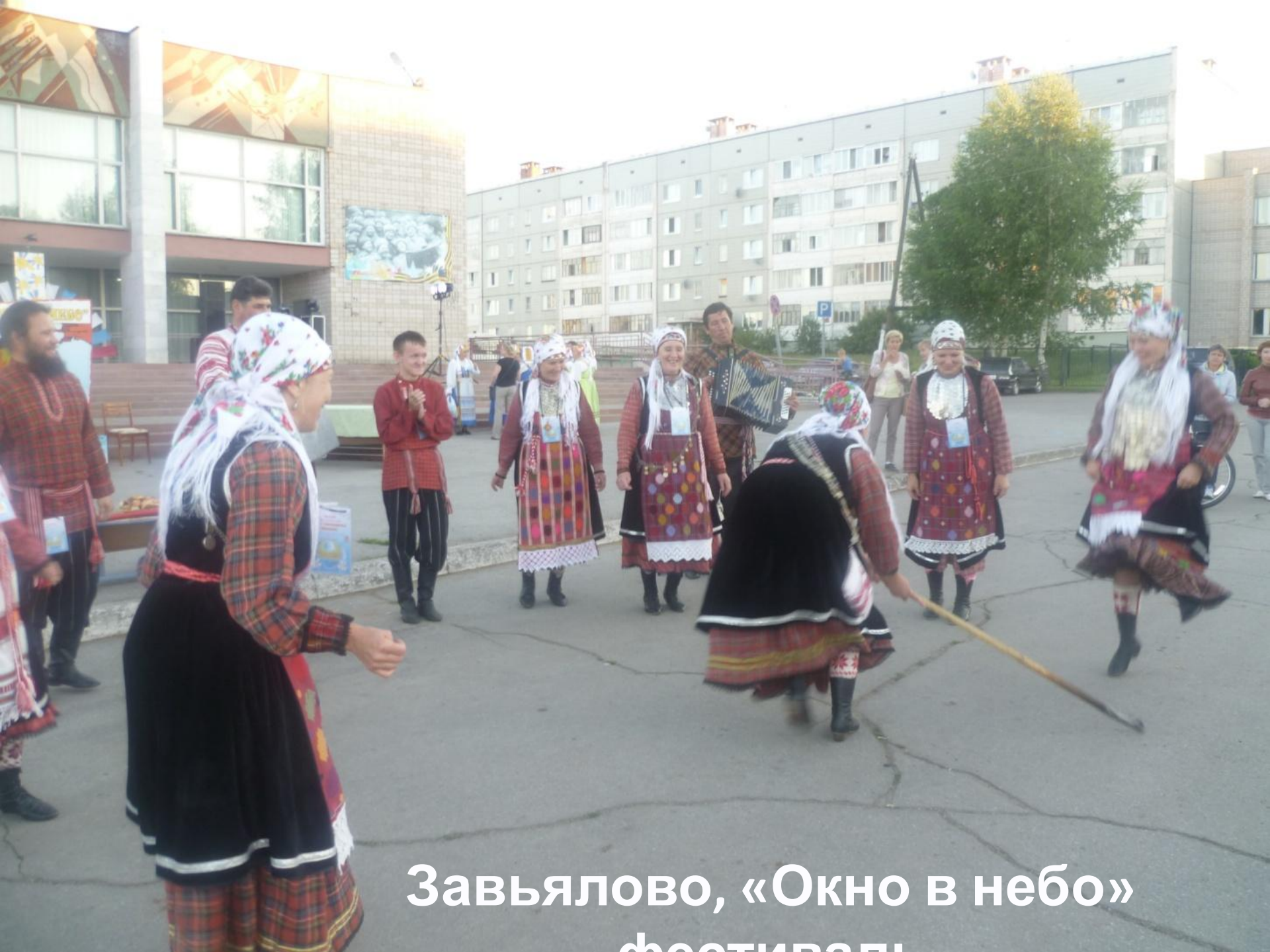
Завьялово, «Окно в небо» фестивал