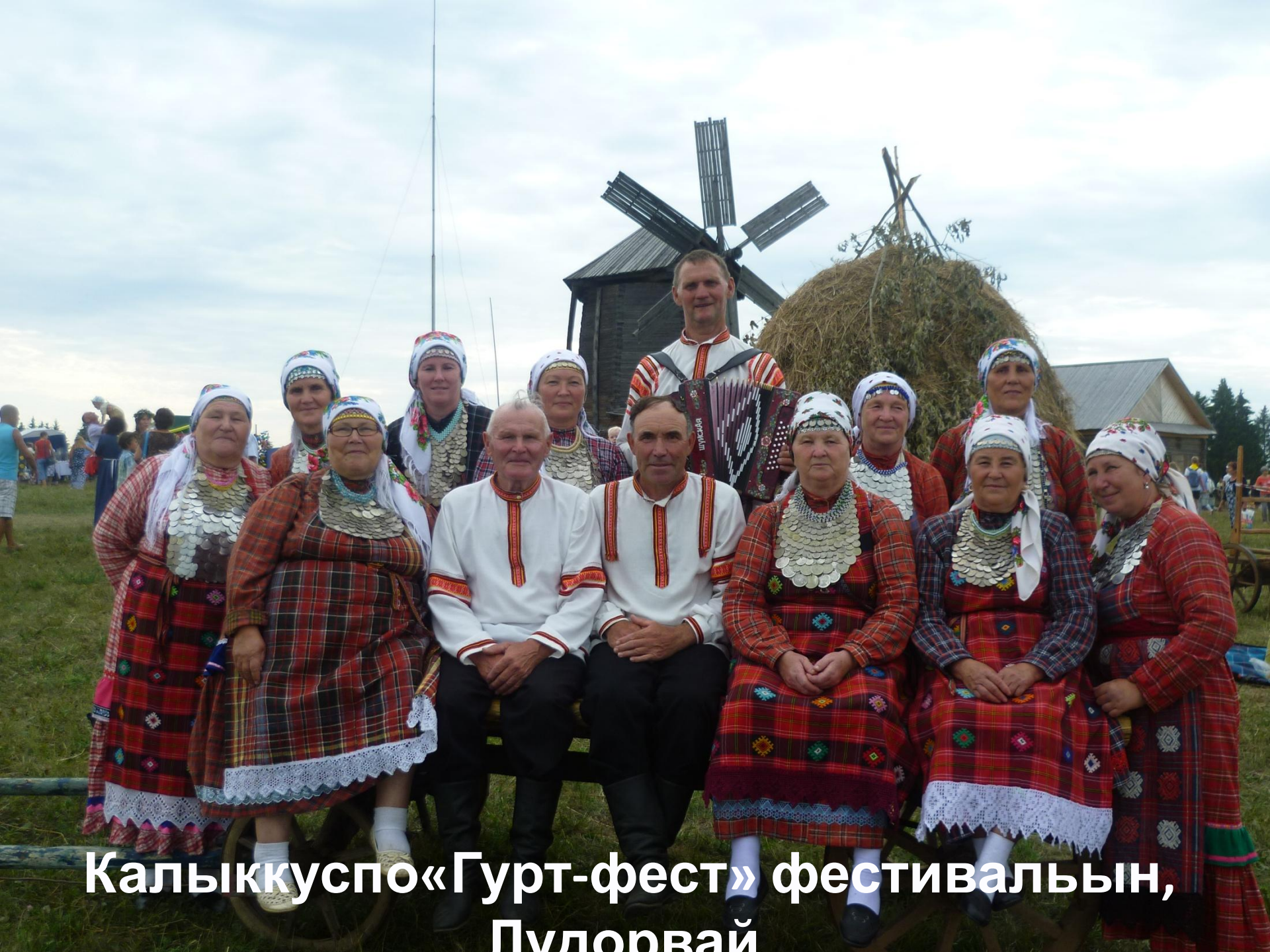
Калыккуспо «Гурт-фест» фестивалын, Пулдорвай