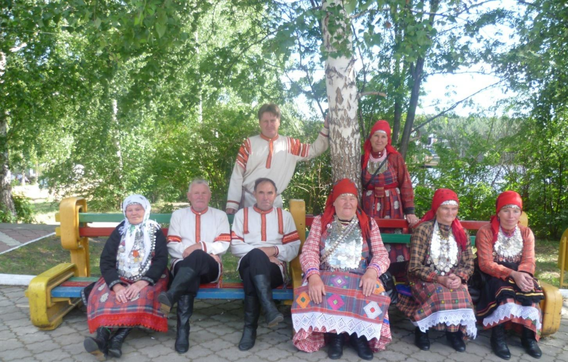
Бажовский фестиваль, Челябинскын