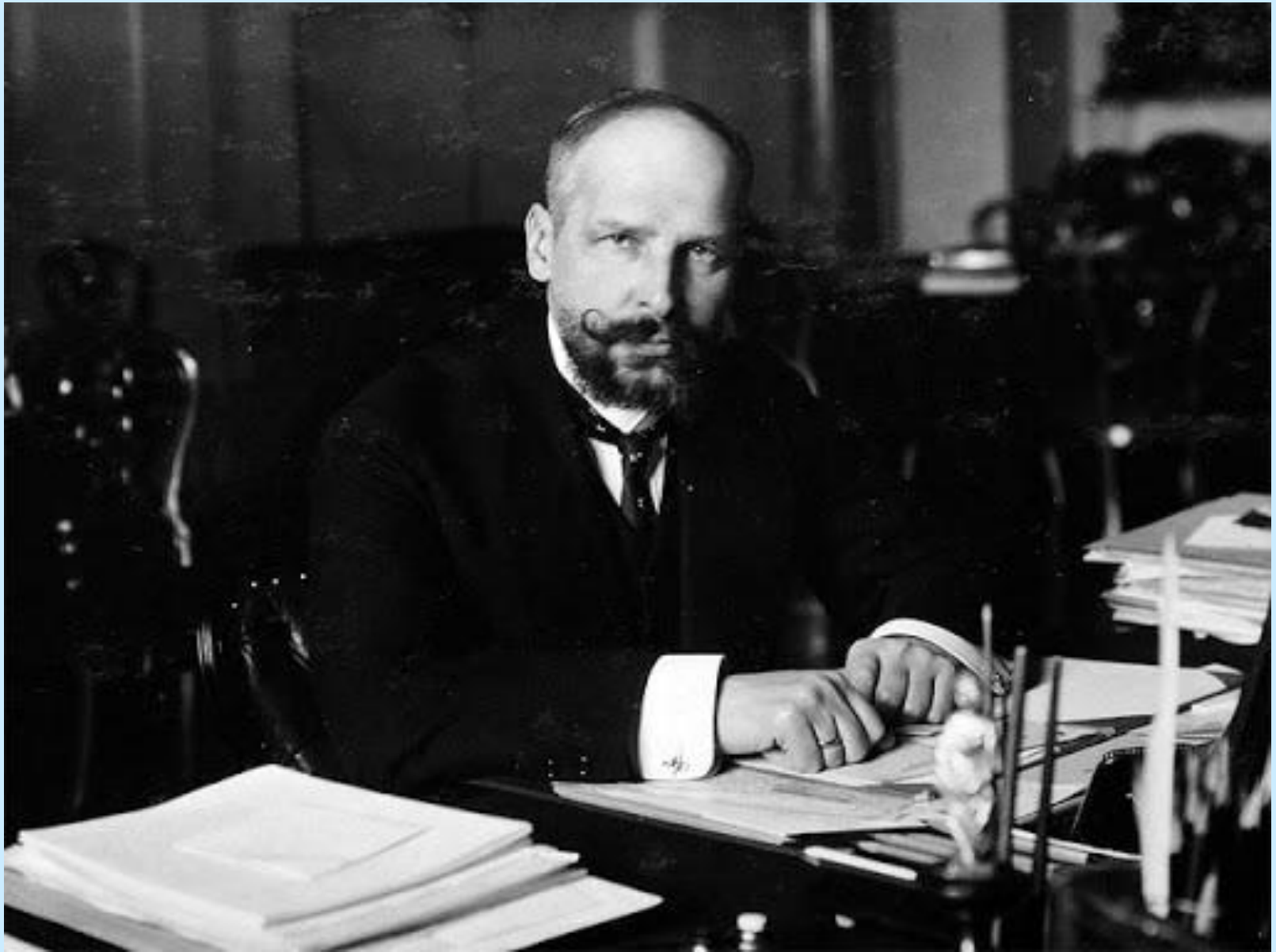
П.А.Столыпин в рабочем кабинете