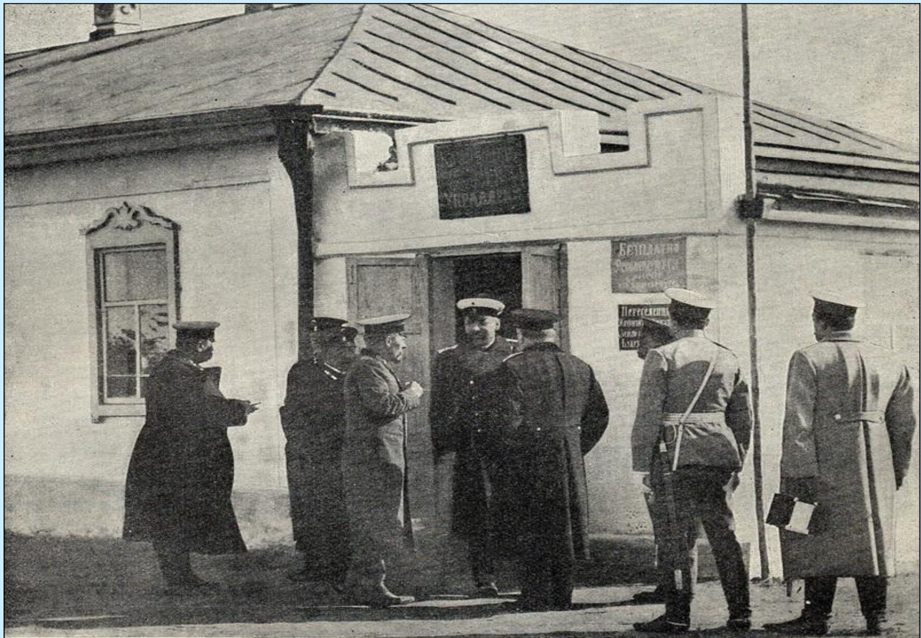
П. А. Столыпинъ и А. В. Кривошеинъ въ пос. Славгородъ осенью 1910 г.