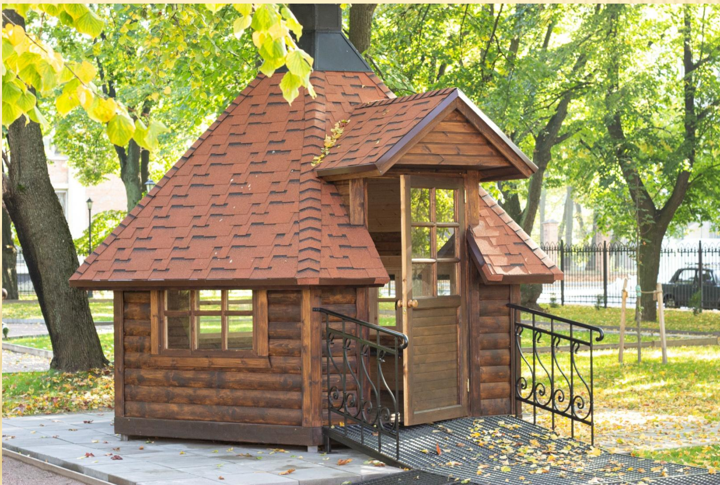
Уютная беседка на территории парка