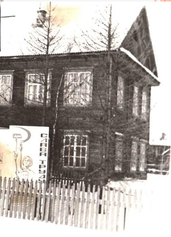
Старые фотографии посёлка