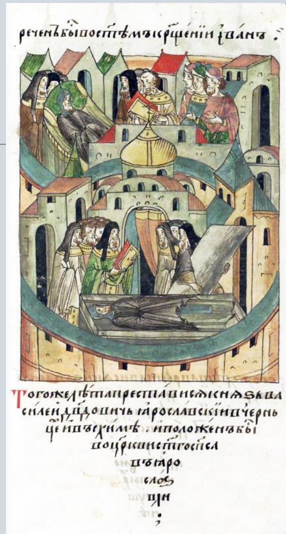
Смерть князя Василий Давыдович Грозные Очи (Грозный)

В 1321 году появилось Моложское княжество - по смерти ярославского князя Давида сыновья его, Василий и Михаил, разделили его владения: Василий, как старший, наследовал Ярославль, а Михаил получил удел на реке Мологе и поселился, там, где, стоял город Молога.