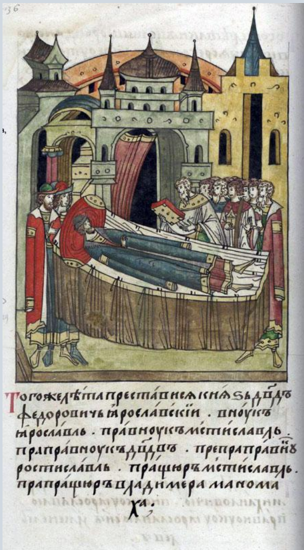
Лицевой летописный свод: «В том же году преставился князь Давыд Федорович Ярославский»