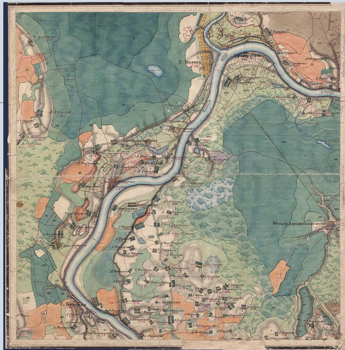
Город Молога и его южные окрестности. Из «Атласа Ярославской губернии» 1858 года

В конце XIX века Молога представляла собой небольшой узенький длинный город, принимающий оживлённый вид во время нагрузки судов. От Мологи начиналась Тихвинская водная система, одна из трёх, связывающих Каспийское море с Балтийским.