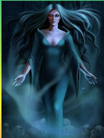
Мста – богиня мести.

Лихоманки – злые сестры, которые были предвестниками болезней. 12 сестёр каждая отвечала за определённый вид болезней как на физическом уровне, так и на душевном.