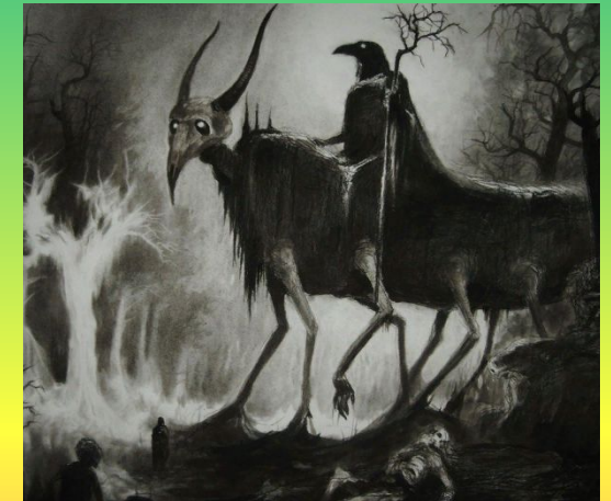
Черная немочь – злобный дух, который нападает на домашний скот и выпивает из него жизнь.