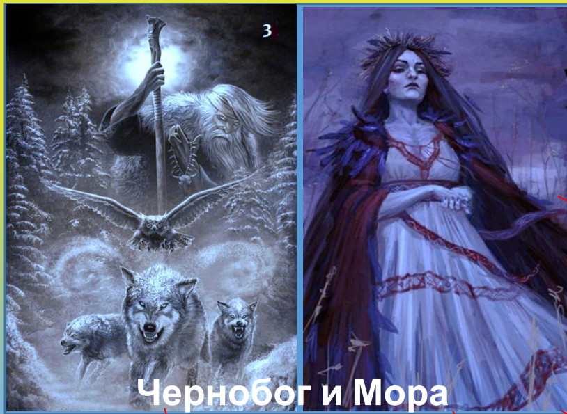
Чернобог и Мора