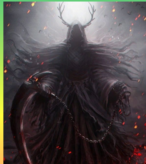
Мор – божество смерти и несчастий.