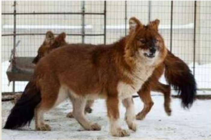
Красный или горный волк