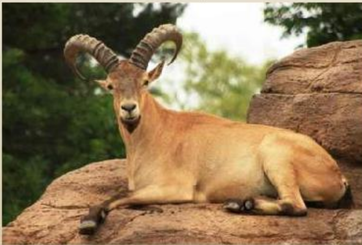
Западнокавказский тур или кавказский горный козел