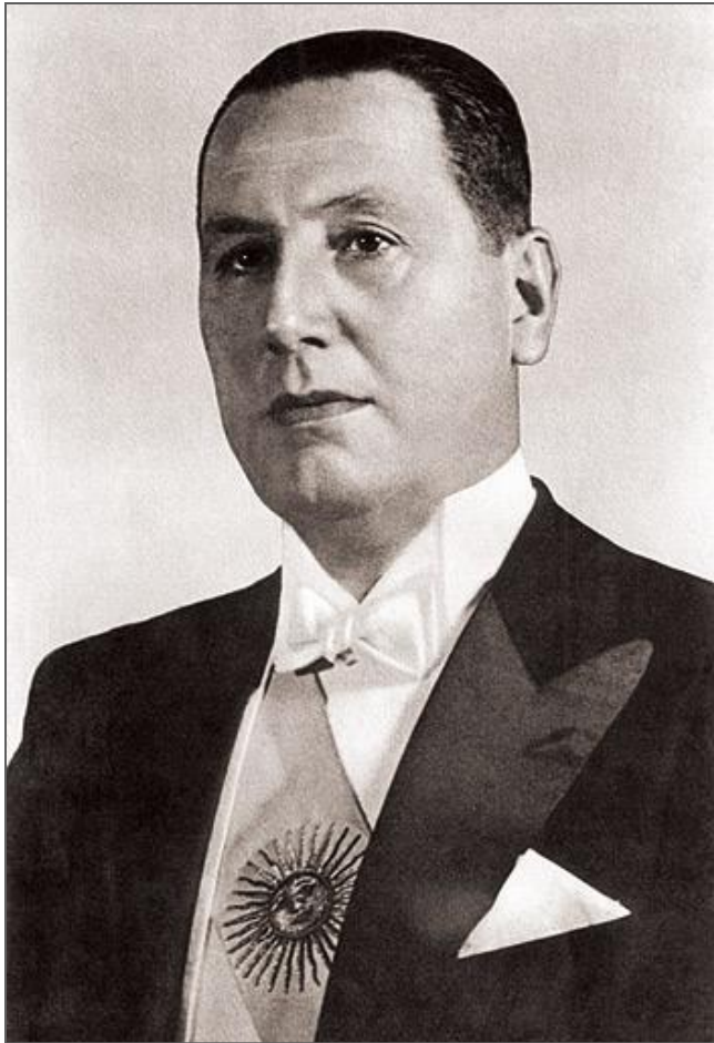
Хуан Перон (1946 - 1955) и (1973 - 1974)