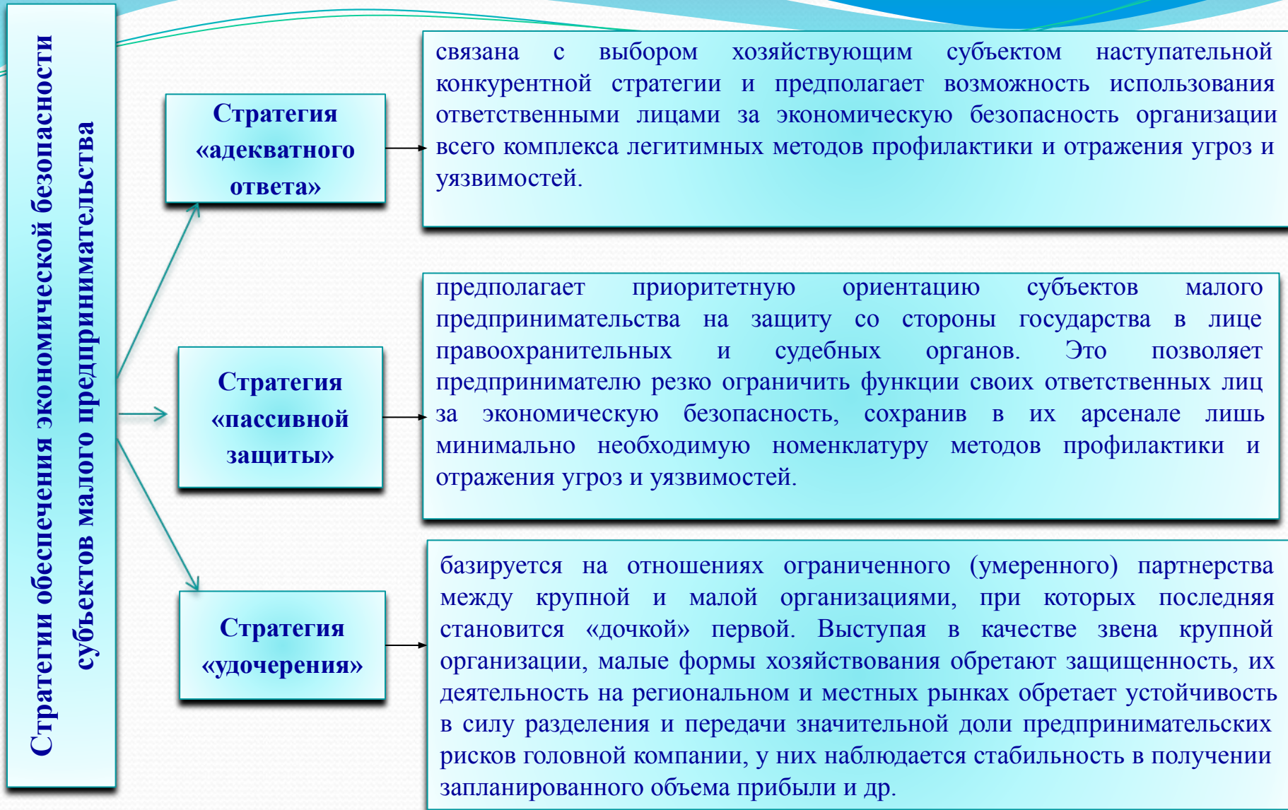
Рисунок 4 – Стратегии обеспечения экономической безопасности субъектов хозяйствования в сфере малого предпринимательства