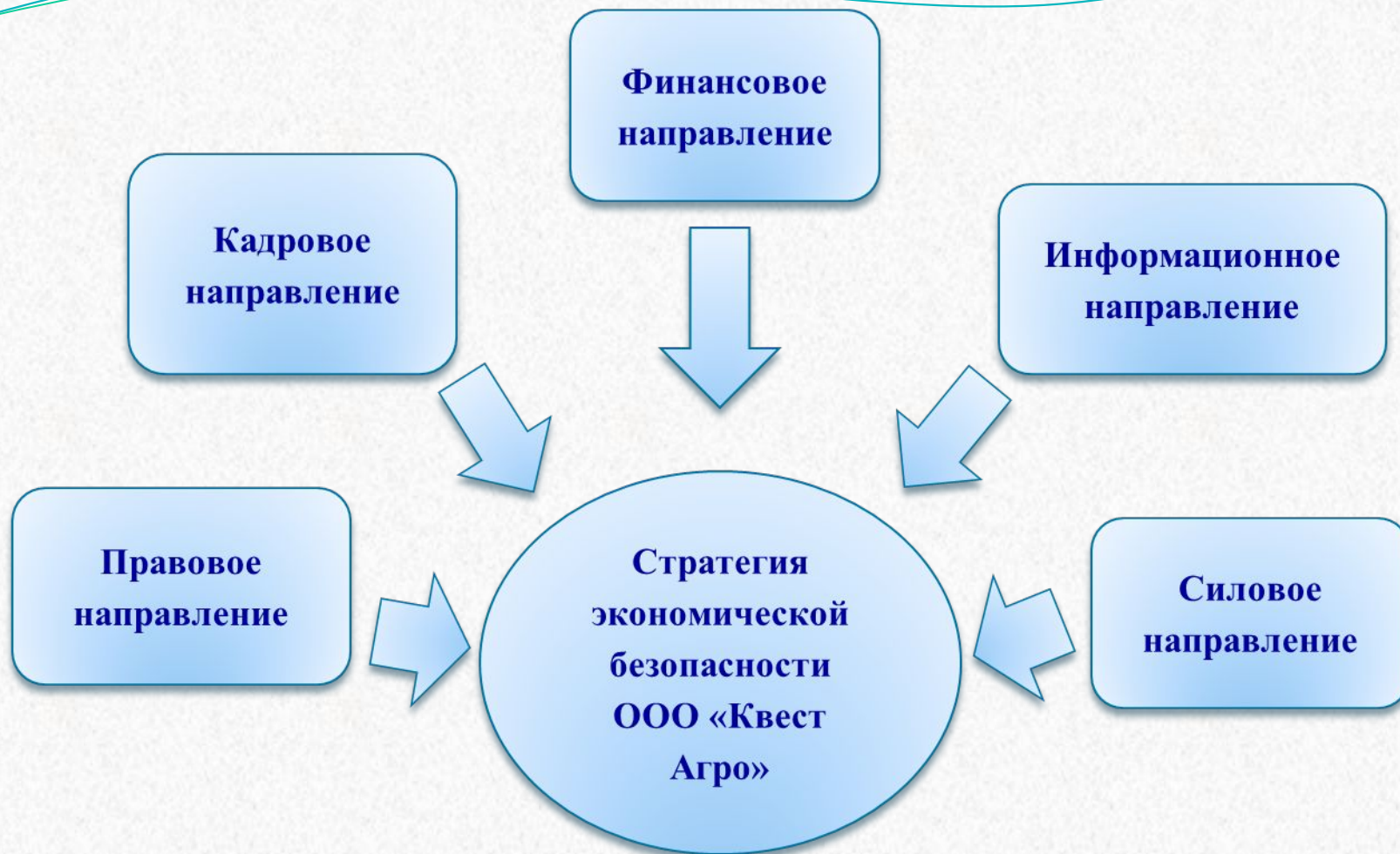
Рисунок 5 – Стратегические направления экономической безопасности организации